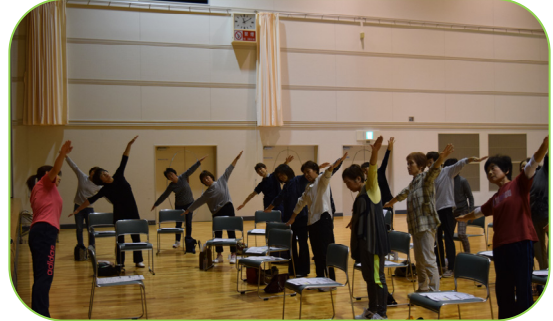
▲トレーニングの指導