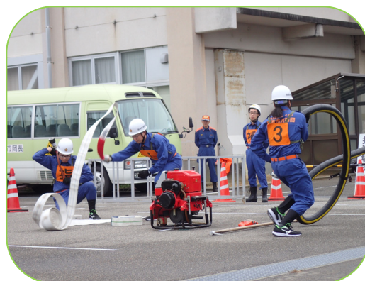
▲小型ポンプ操法競技会