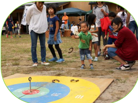
▲てい鉄の輪投げ。上手に入るかな？