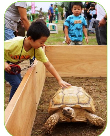
▲寺泊水族博物館から陸ガモも出張してきたよ！