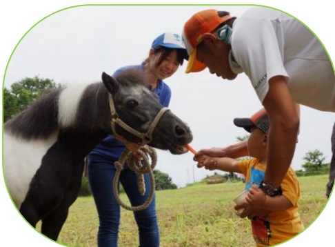
▲美味しいニンジンだから食べて！

9月13日(日)、寺泊野積センターで「ポニーカーニバルin 寺泊」が開催されました。子どもたちは、かわいいポニーの乗馬体験をしたり、直接あげたエサを食べる姿に大喜びしていました。