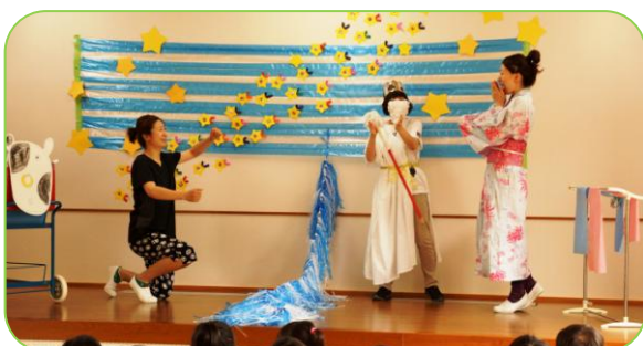
▲保育園の先生たちが七夕の由来を演劇で説明！