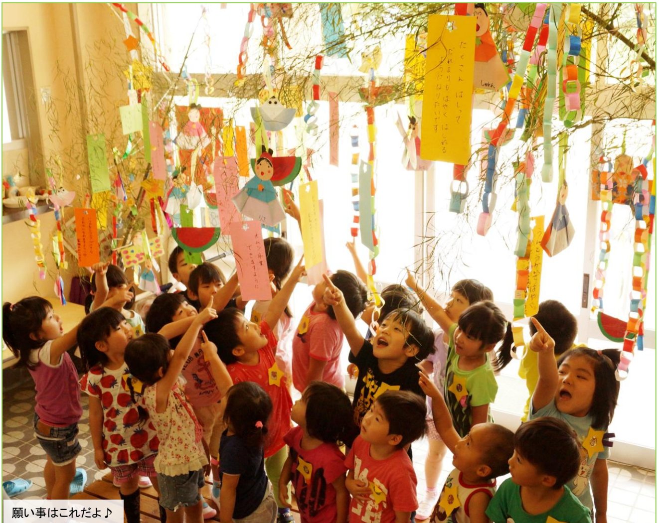
願い事はこれだよ♪

7月7日(火)、白岩保育園で七夕会が開催されました。 玄関には、園児たちの「お医者さんになりたい」「いっぱい走れるようになりたい」など願い事を書いた短冊が大きな笹に飾られていました。みんなの願いが叶うといいね。