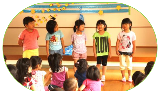
▲年長児が一人ずつ「願い事」を発表しました！