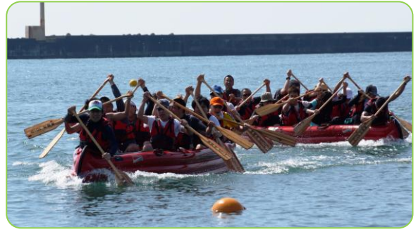
▲優勝した「海とBEERとBBQ」(見附市)チーム【写真左】

白熱したレースの合間に、多くの参加者が寺泊名物の屋台村に詰めかけ、大好評でした。