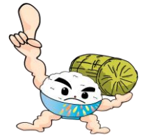
▲長岡うまい米キャラクター 「まんまくん」

【問い合わせ】長岡うまい米コンテスト実行委員会(農政課内) ☎39-2223 FAX:39-2284