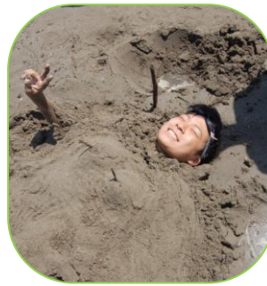
▲これもサンドアート!?

7月27日(日)、中央海水浴場で、サンドアートコンテストが開催され、県内外から18チーム84人が参加しました。浜辺には、アニメのキャラクターや動物などさまざまな作品が出来上がりました。