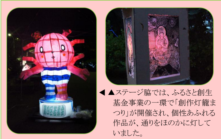
▲ステージ脇では、ふるさと創生基金事業の一環で「創作灯籠まつり」が開催され、個性あふれる作品が、通りをほのかに灯っていました。