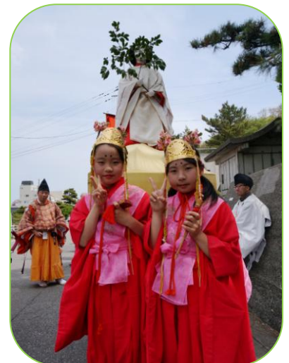
▲天鈿女命と一緒にハイポーズ！