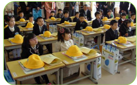
▲大河津小学校(4月7日)▼

小学校で入学式が行われ、寺泊小学校は41名、大河津小学校は23名の新1年生が入学しました。