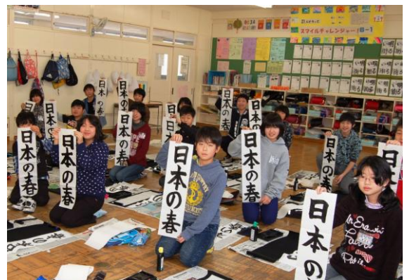
力作がずらり！ 1月10日寺泊小