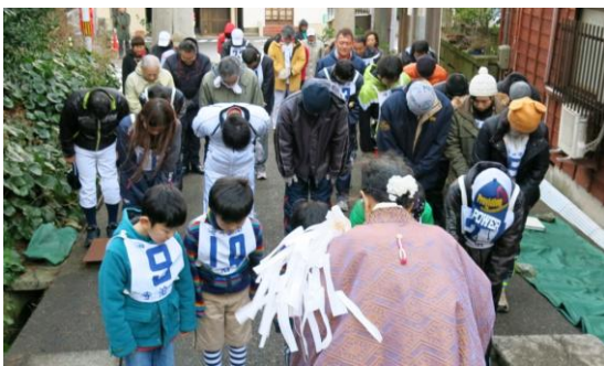
無病息災のお祓い