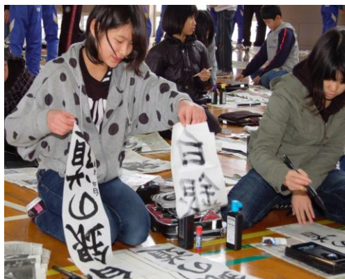
どっちがいいかな？ 1月9日大河津小

参加した児童たちは真剣なまなざしで筆を持ち、一文字一文字ていねいに書き上げ、満足そうな表情でした。