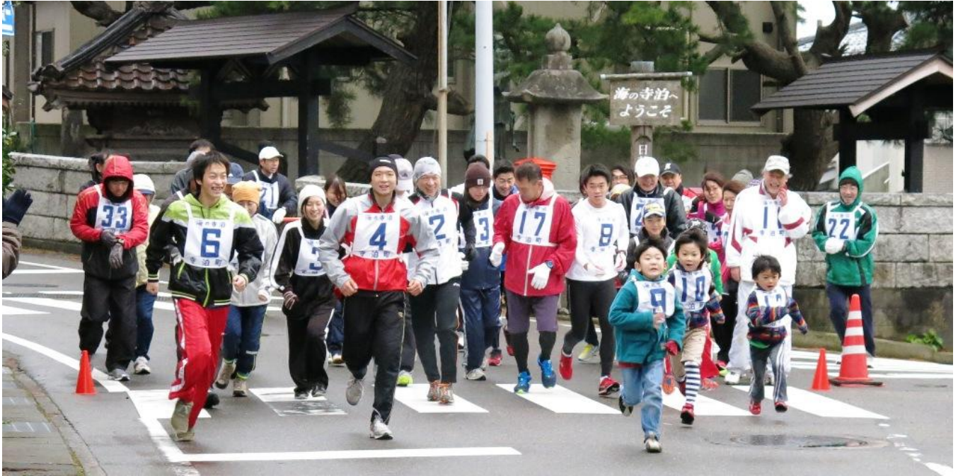
1月1日 白山姫神社前