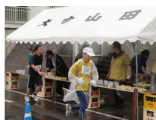
地元集落のおもてなし