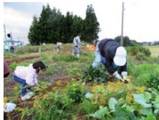
(ボランティアも花壇の手入れに汗を流しました)

委員からは活動に対する共感、誰でも安心して集える「憩いの場」としての期待と今後の整備に向けた前向きな意見が出されました。