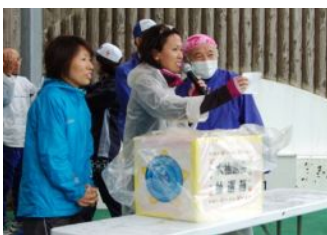
好評のお楽しみ大抽選会