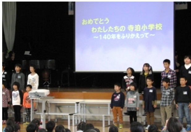
(140年を振り返る生徒たち)

会場では、子どもたちの張りのある元気な声で寺小140年を振り返りました。明治7年、照明寺での学校設立から、新校舎の建設、潮風の林整備と、これまでの寺泊小学校の歴史を画像と共に紹介されました。また、終了後は、音楽会が行われ、各学年が日頃の練習の成果を発表し、会場から盛大な拍手が送られました。