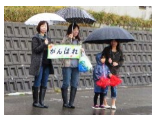
選手たちに温かい声援