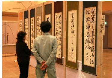
寺泊文化センター会場

今年も絵画、書道、写真、盆栽など愛好者の作品が多数展示され、2日間で延べ1,200人余りの皆さんが観賞されました。