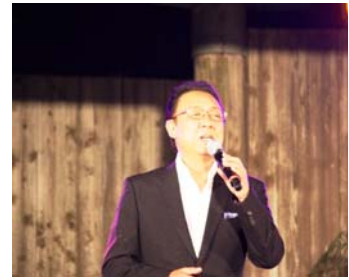
“梅沢富美男さん”熱唱