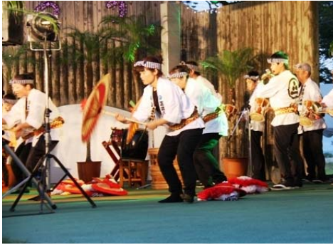
伊勢崎市“上州国定睦”による八木節公演