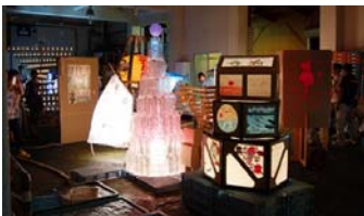
「灯籠コンテスト会場」

7月27日、みなと公園周辺で、灯りの祭典と越後長岡・暮らし文化の祭典が同時に開催されました。灯籠コンテストや合併地域の郷土芸能が披露され、訪れた観客の皆さんを楽しませていました。なお、予定されていた灯籠流しは、悪天候により8月17日に変更となりました。