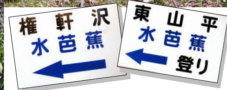
↑現在、案内看板を作成中