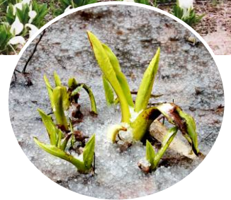
↑春を待つミズバショウ (3月9日現在)