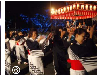
①日本海を美しく染めた海上フェニックス花火 ②寺泊太鼓の演奏 ③会場に駆けつけた国体マスコットのトッキキは子どもたちに大人気 ④伊勢崎市の上州八木節会 ⑤ゲストの歌声にうっとり ⑥イルミネーションに包まれながらの民謡踊り