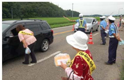
▲交通指導所でドライバーへ安全運転を呼びかけ