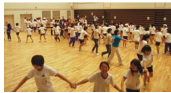
▲オリエンテーション

●第30回両泊子ども交歓会 (7月25、26日・会場Ⅱ寺泊) 両地区の子どもたちが、交歓会を通して楽しい思い出をつくりました。