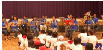
▲歓迎ミニコンサート

●第60回両泊親善体育大会 (7月18、19日・会場Ⅱ赤泊) スポーツを通して両地区の友好と親善を深めました。 総合成績 寺泊 140点 赤泊 100点