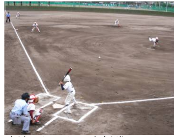
寺泊マリンスターズ：優勝

8月30日・31日、伊勢崎市で伊勢崎市・台東区・寺泊の子どもたちが野球とサッカーで熱戦を繰り広げました。また9月6日・7日には、伊勢崎市の少女バレーボール2チームを迎え、親善試合を行いました。スポーツで汗を流した後も、それぞれ交流を深め、子どもたちにとつてはかけがえのない思い出ができたようです。