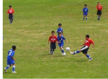
寺泊少年サッカークラブ：準優勝