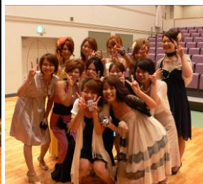
▲久しぶりの再会に笑顔で記念写真