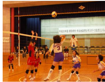
寺泊ジュニアバレーボールクラブ：準優勝