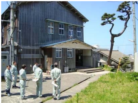
聞き取り調査(写真：上)と視察の様子(下)