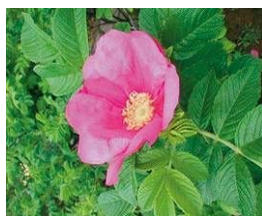
寺泊地域の花(ハマナス)