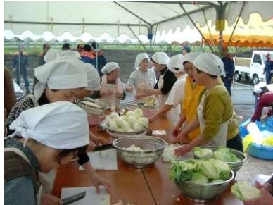
▲日赤奉仕団の皆さんによる炊き出し訓練