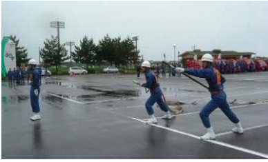
▲小型ポンプ操法訓練(第2分団)

5月25日(日)、長岡市消防団寺泊方面隊による春季消防演習を、寺泊文化センター駐車場で実施しました。小型ポンプ操法や新島崎川での一斉放水訓練、団員及び団車両による分列行進等を行い、同時に長岡市地区寺泊分区日本赤十字奉仕団による炊き出し訓練も行われました。