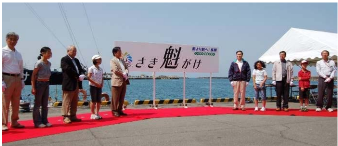
除幕式(写真：右)と体験乗船の様子(左)