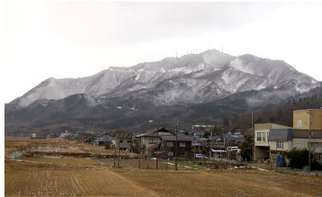
雪化粧した弥彦山（1／1）