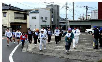
第5回寺泊元旦マラソン（1／1）