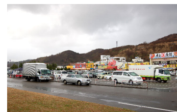
魚の市場通り駐車場（1／3）