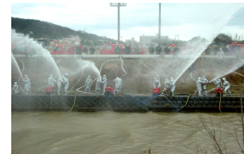
寺泊消防団出初式（1／6）