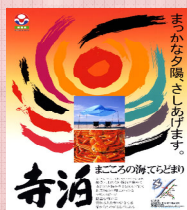
平成19年度ポスター