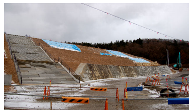
整備が進む寺泊支所（1／3）