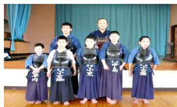
初稽古（夏戸剣友会 1／2）