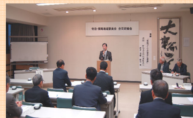
寺泊文化センター大研修室

「守門岳から日本海」、広くなった長岡市が良くなるように皆さんのご努力をお願いしたい。