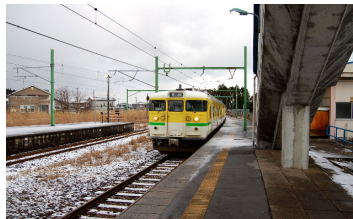
まちの風景（寺泊駅 1／1）