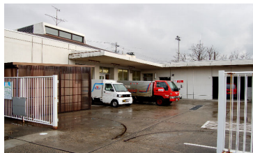
配達に忙しい寺泊郵便局（1／3）