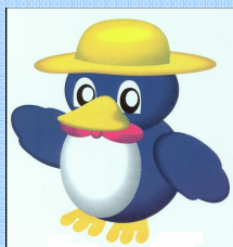
長岡市環境キャラクター ペギーちゃん

ただし、引越し等で大量のごみが出た場合に限り、中之島クリーンセンターへ持ち込むことができます。その際は、必ず事前に電話をしてから持ち込んでください。