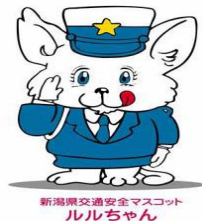
新潟県交通安全マスコット ルルちゃん