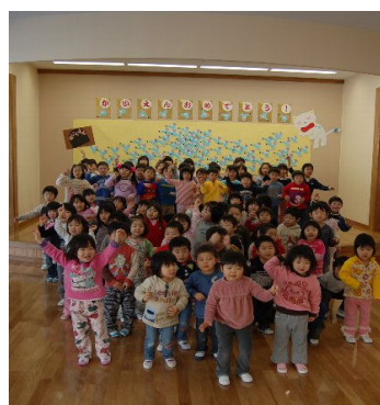
元気に遊ぶ園児達