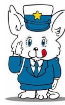
新潟県交通安全マスコット ルルちゃん

「冬の交通事故防止運動」が実施中です。 運動実施期間 12/11(火)から12/20(木)まで スローガン 『飲酒運転 しない させない 許さない』 運動の重点 〇〇 飲酒運転の根絶 〇〇 高齢者の交通事故防止