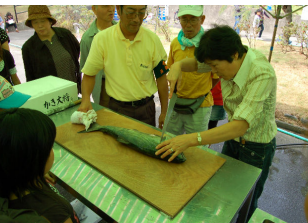
魚の料理づくり体験