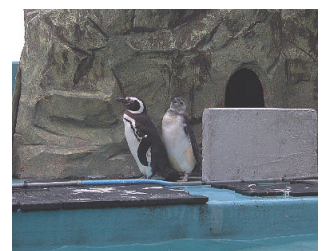
巣から出てきた 赤ちゃん（右）