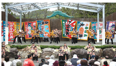
みなと公園ステージ

『観光のまち寺泊』のシーズン幕開けを告げる「寺泊観光まつりとよさこいフェスティバル」に、15,000人のお客さんが詰め掛けました。