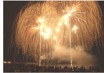
夜空に映える海上フェニックス

また、歌手の歌声に、多くのお客さんが魅了されました。7日の「海上大花火大会」では、12万人のお客さんが『海上フェニックス』を観賞しました。