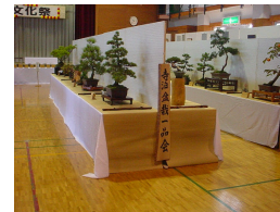
センター おおこうづ会場

寺泊地域の皆さんの絵画や書道、菊や生け花・盆栽などの作品展示を始め、茶道体験教室やバランスのとれた食事をテーマにした「食と健康フェスタ」などが行われました。