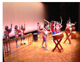
大河津小 若竹太鼓部

第24回てらどまり芸能祭。今年は、栃尾地域の芸能団体も特別出演。各種団体の伝統芸能の披露など、さまざまな催しが文化の秋を彩りました。