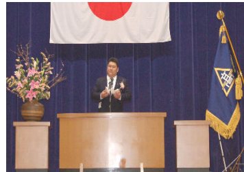
卒業生代表あいさつ