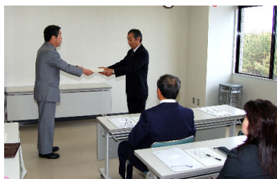
支所長から委嘱状交付

寺泊地域のまちづくりなどについて協議する寺泊地域委員会の委員が任期満了に伴い、改選されました。