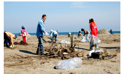
中央海水浴場での様子