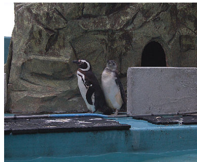
巣から出てきた赤ちゃんペンギン(右)

5月20日に生まれたマゼランペンギンの赤ちゃんは、体長が約40㎝、体重が約4kgまでになり、もう少しすると親ペンギンと歩いたり泳いだりすることができるようになるそうです。