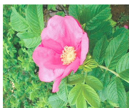
寺泊地域の花(ハマナス)