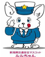
新潟県交通安全マスコット ルルちゃん