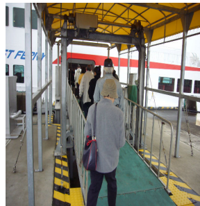
※詳しくは、寺泊観光協会まで（☎75・3363）

4月5日（木）、毎年恒例の寺泊酒造従業員組合「清酒品評会」が、寺泊支所で開催されました。