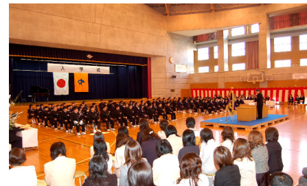
4月9日(月) 寺泊小学校 新1年生 36人