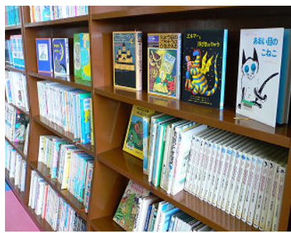
（大河津地区図書室）