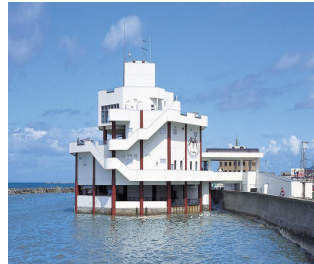
今年度も多くの方が訪れています