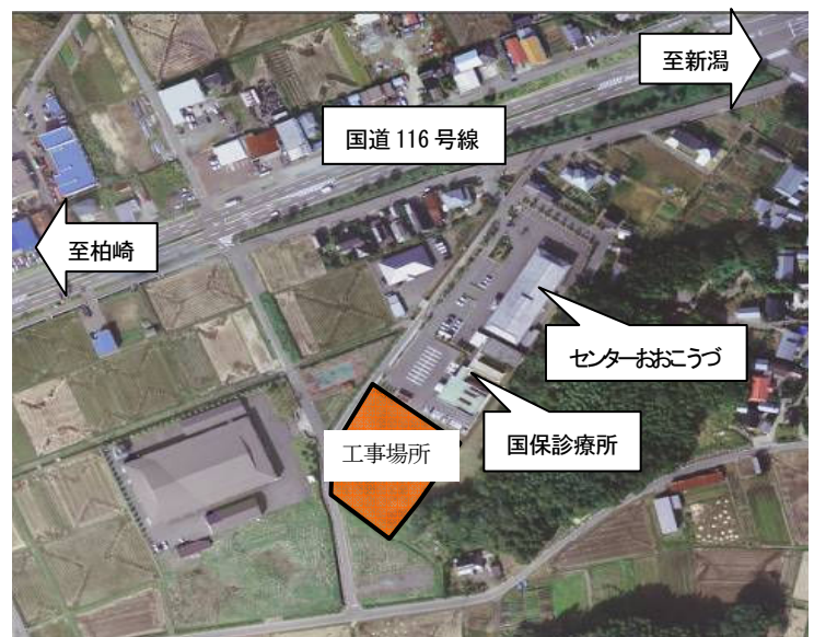
工事場所位置図(国保診療所隣り)

担当：長岡市児童福祉課 (☎0258・39・2219) 寺泊支所保健福祉課 (☎0258・75・3114)