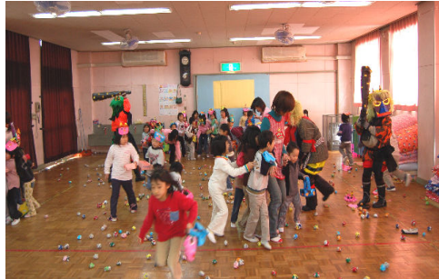
鬼の迫力に圧倒された様子！！