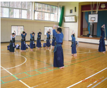
初稽古（夏戸剣友会 1/2）