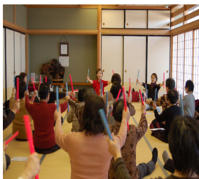
生涯学習活動（「稲穂生涯学習の会」） （センターおおこうづ 1/5）