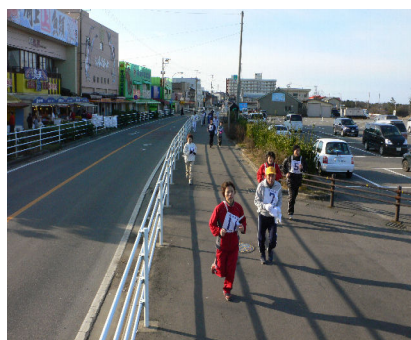
第4回寺泊元旦マラソン