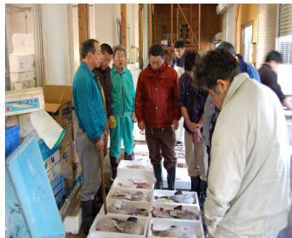
漁協市場の初せり（1/3）