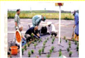
県道長岡・寺泊線の交差点の苗植え (敦ヶ菅根地内)

「まちづくり活動を支援する制度」 「長岡市地域コミュニティ事業」 についてのお知らせ 長岡市は、地域の自治会や町内会などのコミュニティ団体が自主的に行う、産業・福祉・芸術文化・スポーツなどのまちづくり活動に対して支援をしています。 今年度、寺泊地域では、大河津地区の「コミュニティカルチャーフェレンズ」さんが、この事業に採択され、「大河津・山ノ脇地区花いっぱい作戦」を実施しました。 なお、19年度の募集要項などの細かい内容は、3月下旬に長岡市議会で決定される予定です。決まり次第、お知らせをします。