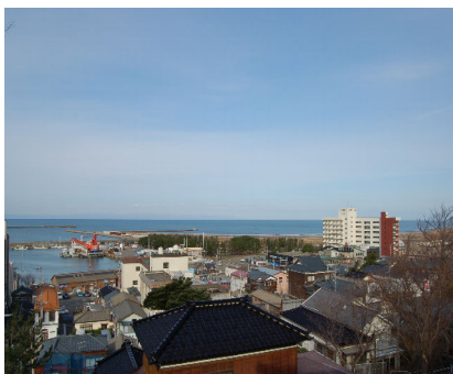
元日風景（白山媛神社から望む）