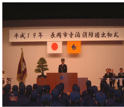
寺泊消防団出初式（1/7）