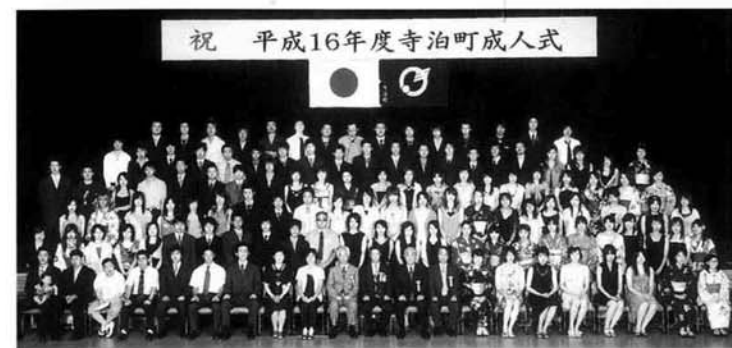
祝 平成16年度寺泊町成人式