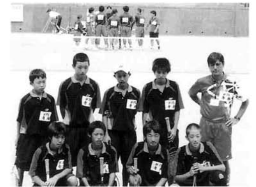
↑男子ソフトテニス