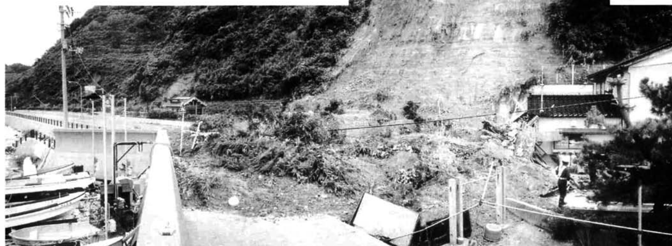
← 山田集落での土砂崩れ現場