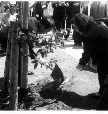
県スポーツ公園内で知事と記念植樹