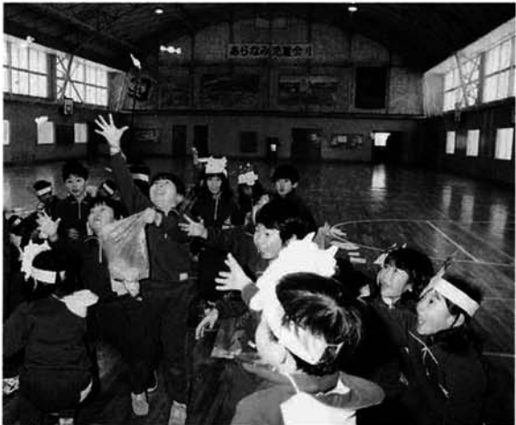
寒い体育館でも子供は元気!(寺泊小)