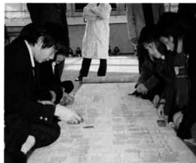
ようし、次は取るぞ!

全校生徒と先生が、それぞれ四人から六人でチームを編成し、授業等を通じて学習し、練習した成果を發揮して、大いに盛り上がりました。校長先生や国語の先生が、「天の