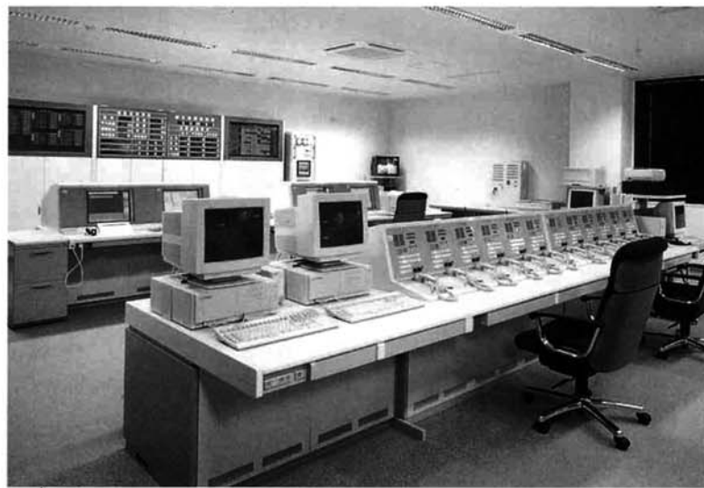
通信指令室/管内を情報ネットワークで結ぶ

個人・団体など、一般見学の申し込みも随時受け付けています。ぜひ防災知識の体験においでください。