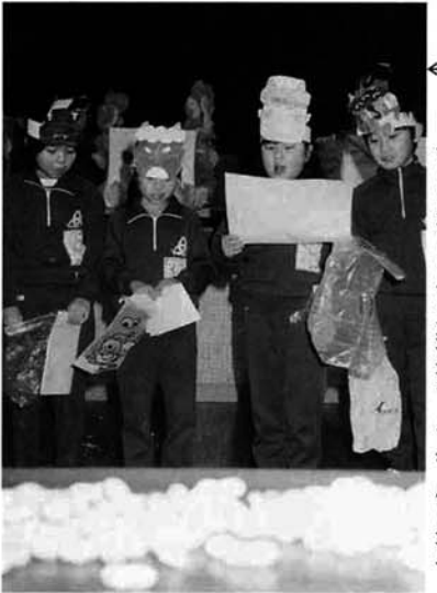
自分の悪い鬼を発表する寺小児童