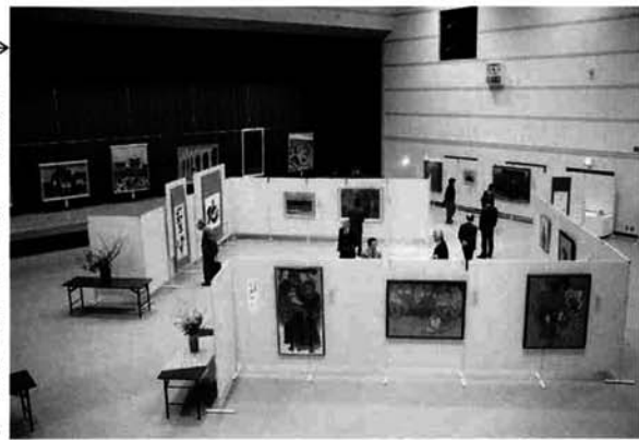
文化センター「はまなす」多目的ホール