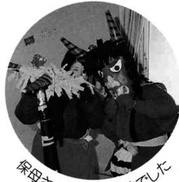
保母さんゴクウさまでした

この冬一番の寒気が入った2月3日、「節分の日」の行事が、町内の保育所・小学校などでおこなわれました。寒い寒い寺泊小学校の体育館では、児童のみんなが、「わるいもの鬼」「ねぼすけ鬼」「おこりんぼう鬼」「泣きむし鬼」など、自分の追い出したい「鬼」を発表して、友達から豆を投げてもらい、「鬼」を追ひ出してもらっていました。保育所では、園児たちが「鬼」を迎えうつまえて歌を歌って元気を見せていましたが、大きな音ともに現れた「鬼」を見た