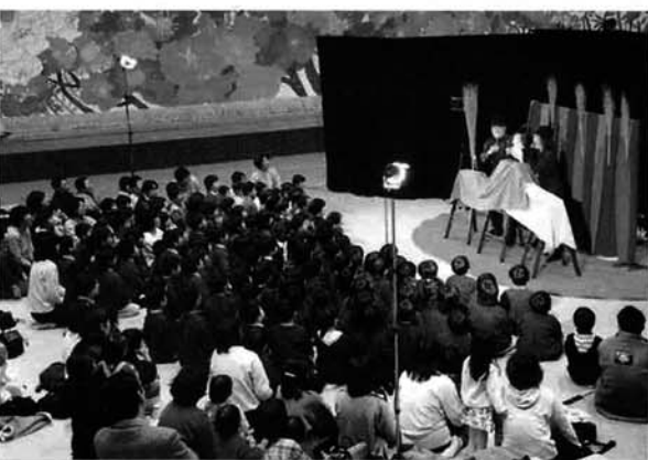
文化センター「はまなす」での人形劇

2月5日、文化センター「はまなす」・センターおおこうづを会場に新潟日報販売会(NIC)中越支部長岡西地区会主催による人形劇が開催されました。この「こどもチャリティー事業」は5年前から始まり、テレビなどでは味わえない感動を寺泊町内の園児に届けたいと企画されたものです。開演と同時に園児たちは、歌や手品の後、軽快でユーモアをまじえた人形劇にすっかり心を奪われ、キラ