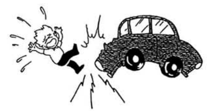
寺泊町の交通事故の発生状況の推移