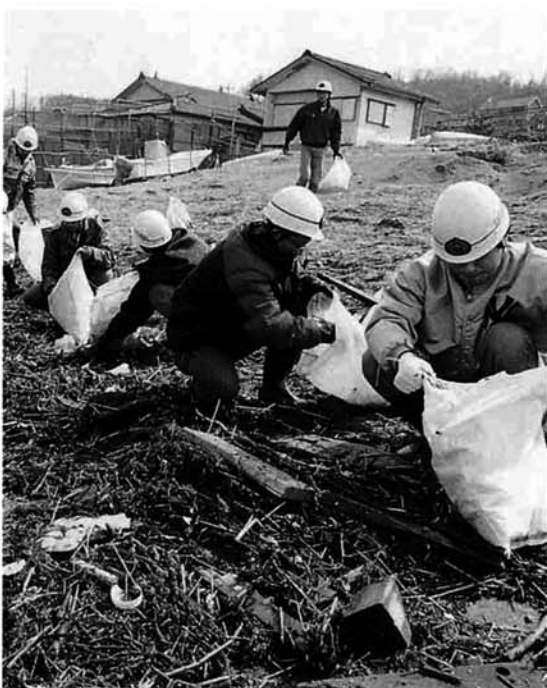
平成9年ロシア船籍タンカーナホトカ号の流出油災害での油防除活動

近年、社会情勢の変化などにより様々な課題を抱えています。40年ほど前まで全国で200万人を超えていた消防団員数が、平成10年4月では96万3千人に減少しています。減少の原因として、都市部では住民の連帯意識の稀薄化、農山漁村部では若者の流失などとともに、従来農業や自営業などに従事している人がたくさんいます。現在の社会などに勤務するサラリーマン団員が大きな割合を占め、新しく入団しにくい要因になっています。