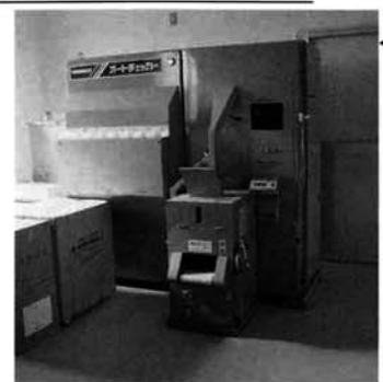
自主検査設備 ・各生産者毎のサンプルが乾燥され、検定装置で歩留測定をおこない検定データを精算事務へ引き継ぎます。