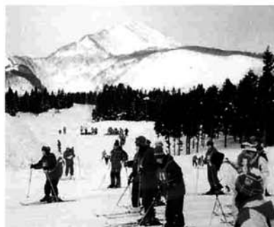
その調子だ! 頑張れ!

豊かな自然環境のもと、スキーの技術を磨きながら、自然と親しみ、級友や先生との親睦を深め、協調性や社会性を養うことを目標とした、一年生のスキー教室が、妙高高原で開催されました。