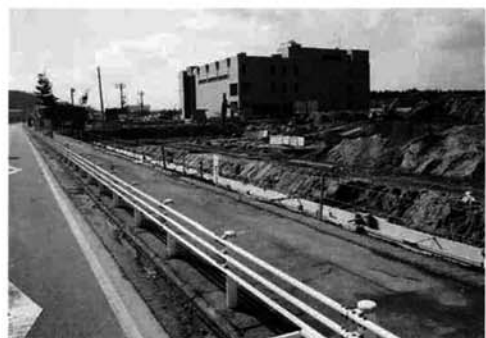
↑保安林(保育)整備事業工事