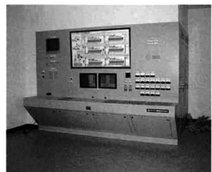
中央監視制御盤 ・カントリーエレベーター内の主要機器装置の操作、監視をおこないます。

精米設備 ・セラミックを使用した低圧精米により碎粒、穀温上昇が少ないので、高い歩留りを実現します。着色粒を除去する選別機を装備。