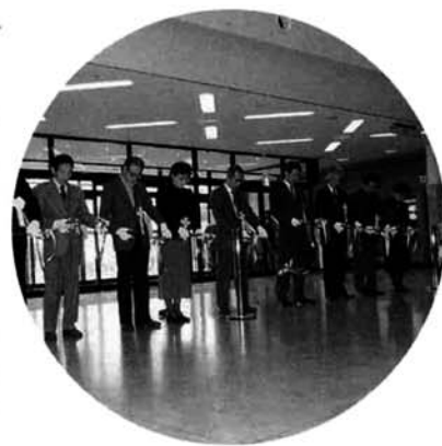
オープニングセレモニーでのテープカット

2月19日～21日の3日間、寺泊町芸術文化協会主催による「寺泊在住作家展覧会」が、文化センター「はまなす」多目的ホールを会場に開催されました。 この展覧会は、初めての試みとして、寺泊町に在住して活躍しておられる作家の、絵画、書道、版画、水彩マンガなどの作品42点を展示したもので、新潟県美術名鑑に掲載されている方や県展に入選されるなど12人の方々の優れた作品が出品され、大勢の人が鑑賞されました。 主催した芸術文化協会では、これからも寺泊にゆかりのある芸術家の作品に触れる機会を設けるなどして、すぐれた芸術家が育つように願っているとのことでした。