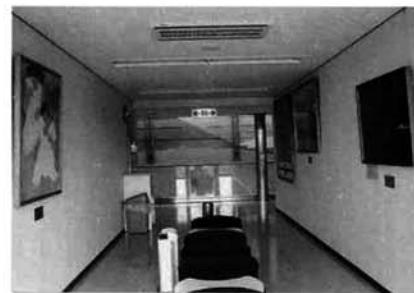
文化センター「はまなす」内

この他にも、文化センターの各部屋や大河津公民館などに力作が展示されています。施設にお寄りの際には、是非ゆっくりご覧ください。