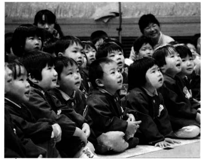
人形劇に夢中な園児