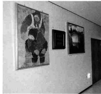
センターおおこうづロビー

文化センター「はまなす」やセンターおおこうづには、寺泊町へ寄贈された絵画などが多数展示されています。このたび、県美術展覧会や県芸術美術展などで入賞して