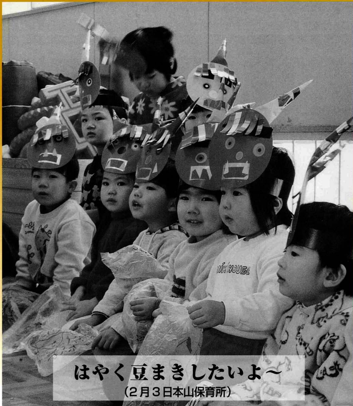
はやく豆まきしたいよ～ (2月3日日本山保育所)