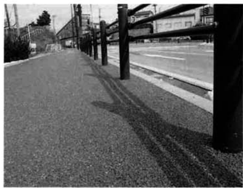
◆高齢者や障害者にやさしい歩道整備