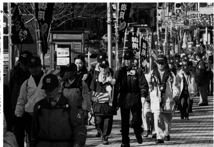
東京都墨田区を出発する本部隊