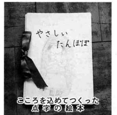
こころを込めてつくった点字の絵本

熱心に指導されています。 部員二五名は、点字を打つことばかりではなく、実際に目かくしをし、校舎内を回り、目の見えな い人の体験をし、体験した部員は「大変恐かった」と口々に目みえないことの不自由さ、恐怖感を強烈に感じたようです。