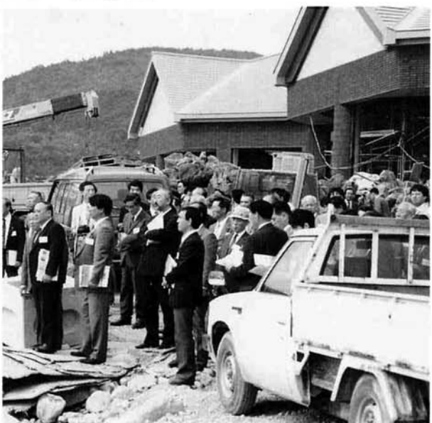
ハイジアパーク南陽を視察する参加者

南陽市における「まちづくりと人づくり」に関して、南陽市の地形からくる二極構造の諸問題、地域エゴ等、現状の課題を通して、これらの課題を解決するために取った数々の手法を実例に基づき貴重なご講演をいただきました。