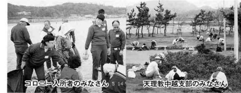
コロニー入所者のみなさん

天理教中越支部のみなさん二二〇名が竹ぼうき、カマを片手に五月一日日みなど公園の一斉清掃を実施しました。 みなさん、額に汗し、一生懸命奉仕活動をしている姿に、公園内で弁当をひろげていた家族づれも、ゴミをきちんと袋の中に入れ、ゴミ箱にとり光景もあちこちで見られ、いい啓発活動にも一役かっています。 また、コロニーにいがた白岩の里でも毎年定期的に町内清掃奉仕を行っています。