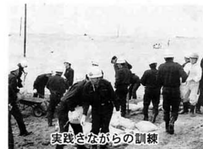
実践さながらの訓練

入梅を前に五月十七日、平和の塔前広場で寺泊町の水防事前訓練、そして二六日には小千谷妙見堰左岸下流河川敷で午前九時から一三時まで、各種の水防工法が消防団員総勢九一五名が参加して大々的に行われました。 寺泊町は、消防団長以下第七、八分団六〇名の参加で月の輪工法、改良積み土のう工法が行われました。