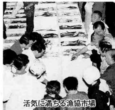
活気に満ちる漁協市場

昭和二〇年代ころは、魚がとれすぎたせいか漁師が網から魚をきれいにしずくのをめぐり、魚があちこちついたままの網が港いっぱい干されていました。そんな光景を思わせるほど浜では、大漁に水揚げされ、魚で活気に溢れていました。