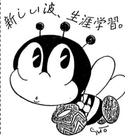
デザイン：石ノ森章太郎

Suki 好きなときに Suki 好きな場所で Suki 好きなことを学ぶ バラ色の3S とすることができます。 家庭は 生涯学習の基点であり…… 学校は 生涯学習の基礎づくりの場として 地域社会は 生涯学習の拡充の場として…… お互いに関連つけてゆかなければなりません。 また、9月より学校週5日制が実施されますが、家庭、地域社会がどう取り組むかは、生涯学習の重要なテーマです。