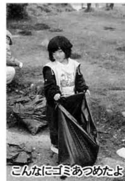
こんなにゴミあつめたよ

天理教中越支部のみなさん二二〇名が竹ぼうき、カマを片手に五月一日日みなど公園の一斉清掃を実施しました。 みなさん、額に汗し、一生懸命奉仕活動をしている姿に、公園内で弁当をひろげていた家族づれも、ゴミをきちんと袋の中に入れ、ゴミ箱にとり光景もあちこちで見られ、いい啓発活動にも一役かっています。 また、コロニーにいがた白岩の里でも毎年定期的に町内清掃奉仕を行っています。