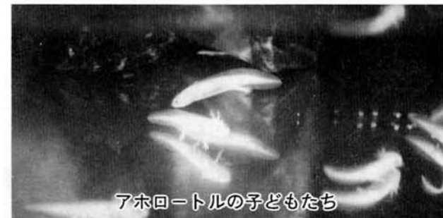
アホロートルの子どもたち

昨年五月号の水族博物館だより にアホロートルの繁殖について紹 介しましたが、今年の二月にも産 卵があり、ふ化後の幼生も順調に 成育しています。それで今回はア ホロートルの成長について紹介し ます。 産みつけられた卵は約二週間か ら三週間でふ化し、全長約1cmほ どの幼生が15尾ほど生まれました。 野生型の体色の黒い幼生と体色 の白い幼生(アルビノ)でした。 まだ前足も後足も出ていない細長 いオタマジャクシのようで、普通 は水温18から20℃に保 たれた水槽の底でじっ としている事が多いの ですが、餌となる生き たプランクトンを与え ると活発に動き出し、 餌を食べます。二週間 ほどで全長2cmほどに なり、前足が出てきま した。その後しばらく して後足も出てきて、 親と同じような体のか わいい子どもたちに成 長し、その頃から餌も 魚やエビのミンチなど を食べるようになりま した。この頃になると