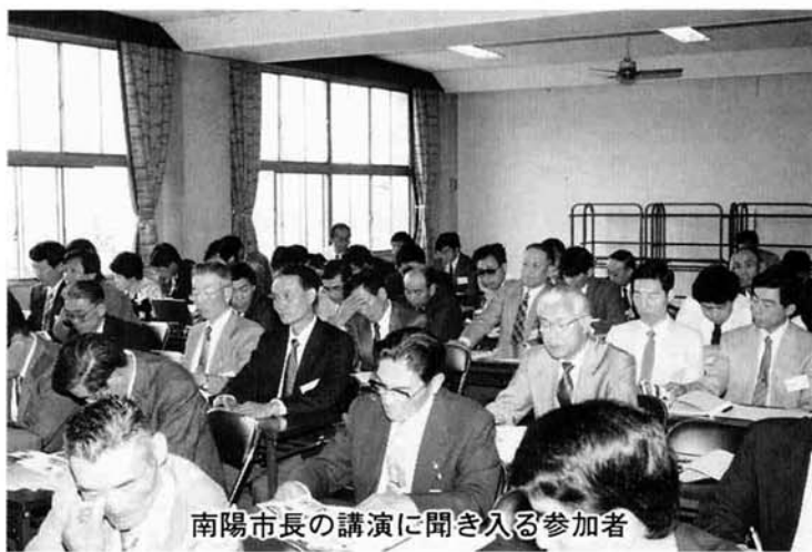
南陽市長の講演に聞き入る参加者

自分たちの事だから自分たち自ら調べる。問題意識を持った人が直接その問題に立ち向かう事で、仲間ができ、そして思わぬところで、地域をより深く愛している人に出会い、また、その人からも励みされ協力をいただく。 白龍湖の形成には地殻についての専門家、また、植物に関しては標高的には分布していないはずの植物が生息している実態を調査していただける人、そして、白龍湖にまつわる民話をお年寄りから聞かせて頂く、本場に多くの方々の協力上での活動とことでした。 それにしても、お話を伺った方々がお忙しい中、それもほとんど夜の時間帯に活動されている事を聞かせていただいたときには頭が下がっている思いでした。 家に帰れば、子供が待っている家族団欒の時間を地域の為に使っておられる。けれども、その事が必要なんだと言いつつ切っておられる自信に満ちた顔。 本場の地域の活性化はこんな地道な活動に支えられて大きく広がっていくのではないのでしょうか。 研修会に参加させていただき本場に有り難うございました。