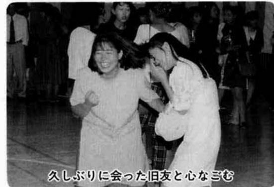
久しぶりに会った旧友と心なごむ