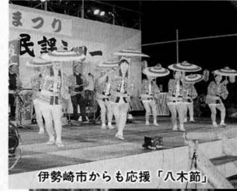
伊勢崎市からも応援「八木節」