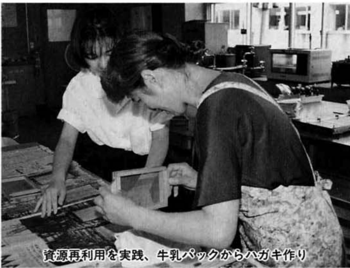
資源再利用を実践、牛乳パックからハガキ作り

「ここ数年「環境問題」に関する報道(テレビ、ラジオ、新聞等)が月を経るごとに年が変わること