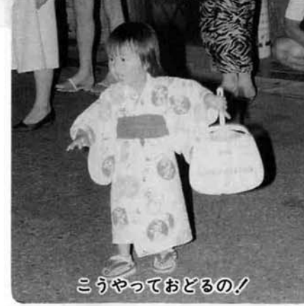
こうやっておどるの!