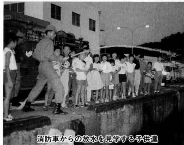
消防車からの放水を見学する子供達

八月九日午後六時三十分から消防署で、毎晩雨の日も風の日もかきず夜まわりし「火の用心」を町内に呼びかけている子供達（大町、上片町、小川町）を招き、「防火のつとめ」を行いました。最初に消防署員から子供達に火の用心をしてきてあげるとのねざらいの挨拶があり、消防署内の見学と火災や救急要請の場合の一一九番通報がどのようにして入るかを見学しました。又、救急車と消防車に同乗、東埠頭を一周し、消防車からの放水を見学、最後に署員から記念品が贈られました。