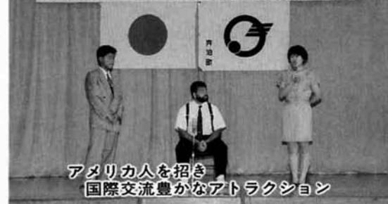
アメリカ人を招き 国際交流豊かなアトラクション