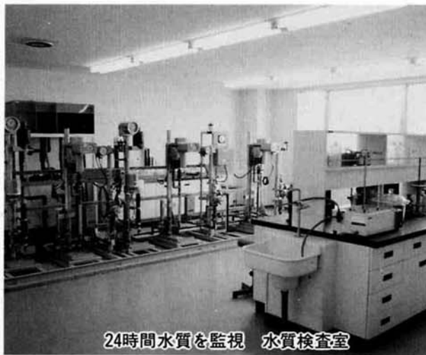
24時間水質を監視 水質検査室

私達は、大河信濃川に抱かれていられるせいか、ひねりさえすればいつでも出る「水」のありがたさを日々感じなくなっているのではないのでしょうか。今、私達が飲んでいる水は、みんな汚した湖や川（大きくは生活全般）の水が循環し、自分達の生活水となっていることを一人ひとりも一度よく考え、ちよつとした心掛けて水道の水はおいしくなることを知ってほしいものです。