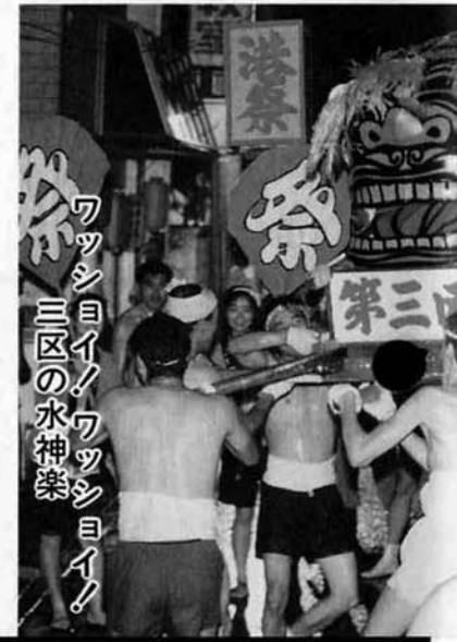
ワッショイノワッショイノ 三区の水神楽