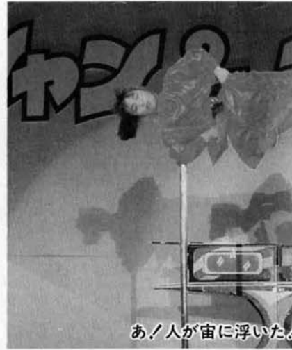
あノ人が宙に浮いたノ (大マジックショー)