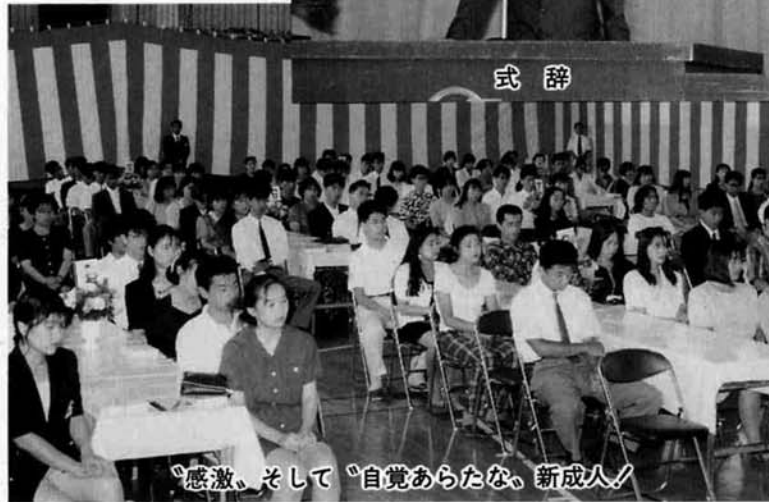
感激、そして「自覚あらたな、新成人」