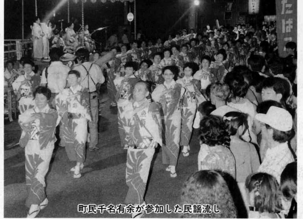
町民千名有余が参加した民謡流し