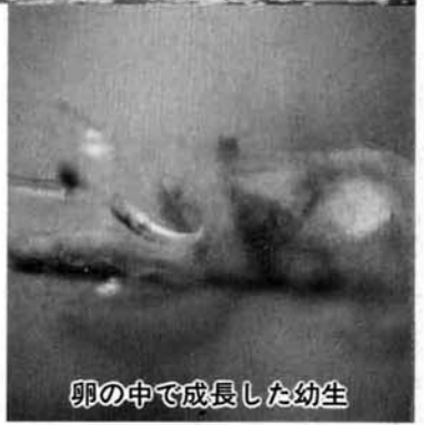
卵の中で成長した幼生

18℃に保たれた水槽で17日後の四月六日からふ化が始まりました。ふ化直後の幼生は1cmほどの小さなもので、まだ前足も後足も出ていない細長いオタマジャクシのような形です。 今後もアホロートルの幼生を大切に育て、その成長の様子をまたお知らせしたいと思います。