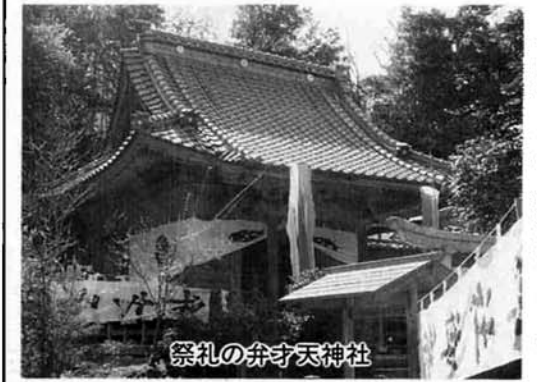
祭礼の弁才天神社

大字本山と弁才天は承応元(二空 三年、吉村の枝郷として吉兵衛・ 源右衛門)によって開発された集落 である。他に人家のない農地のみ の本弁という名の大字がある。両 集落共通の鎮守である弁才天神社 は、由緒書によると「祭神ハ市杵 島姫命・昔、円上寺湯ノ周辺荒蕪 ニシテ未ダ人家アラザル時、コノ 神茲ニ幸シ、永住ノ地トシテ旅衣 ヲ解キタマヘリ」とあり、その証 として当新田字姪子岩の石上に馬 蹄印があるという。つまりこの地 区に村ができる前に湯周辺に弁天 様の祠が建ち、弁才天の村名がこ こに由来したことになる。御神体 は「近年影像甚ダ古ビ寛文二(二空 三年)顔料ヲ塗装シ奉ル」とあるか ら艶やかな弁天像であろう。弁天 様は宝船に乗った七福神の一神で、 島や海岸・湖畔に祀られる例が多 いから、円上寺湯の守護神として 建立されたものと思われる。 記録によると、円上寺湯は周囲 八きしもある沼で、雨が降ると、 周辺や下流に水害をもたらす魔の 沼といわれた。沼の中央の最も深 かったと伝えられる場所に、現在