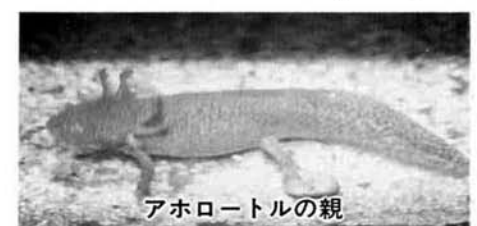
アホロートルの親

を幼形成熟といいますが)とても奇妙な動物です。原産地はメキシコの標高二〇〇〇m以上の高地の冷たい湖です。 水族博物館で産卵したアホロートルは野生型の全長15cmほどの黒い個体で、成熟すると雌は腹がふくらみ全体が丸味を帯び、雄は雌に比べ細長いので見分けることができます。産卵したのは三月二十日で約200個ほどの卵を産み付けました。その後卵は水温