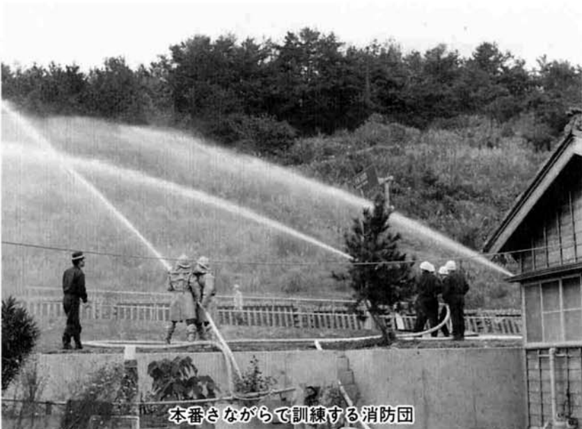
本番さながらで訓練する消防団