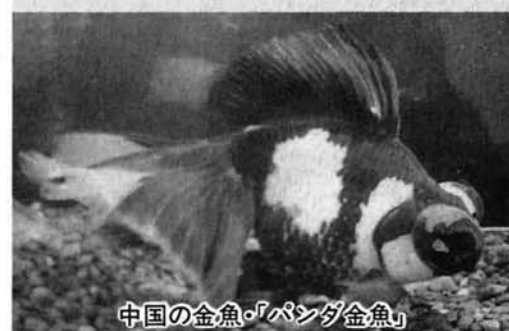
中国の金魚・「パンダ金魚」

日本人にとって金魚は最も身近で愛されている魚ですが、金魚の歴史は古く、中国の東晋時代(二六五年〜四二〇年)に野生のフナが突然変異により体色が赤くなつたものが祖先といわれています。