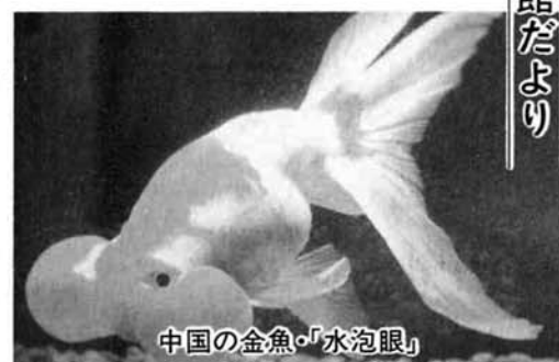
中国の金魚・「水泡眼」