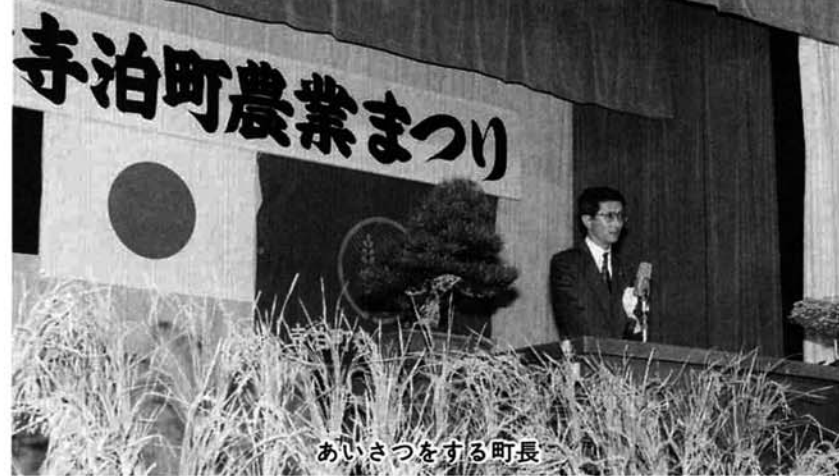
あいさつをする町長