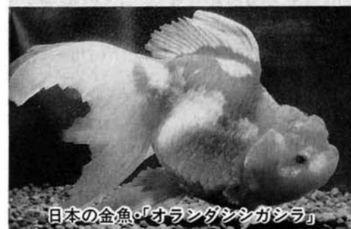
日本の金魚・「オランダシンガシラ」