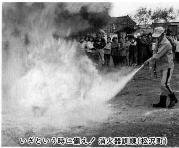
いざという時に備え/ 消火器訓練(松沢町)

私達の日頃の日常生活の中では、火災の原因となる要因がかなり多くあります。少しでも気になったら火の元を確かめる。こうした日頃からの習慣が、あなたの生命と財産を守ります。