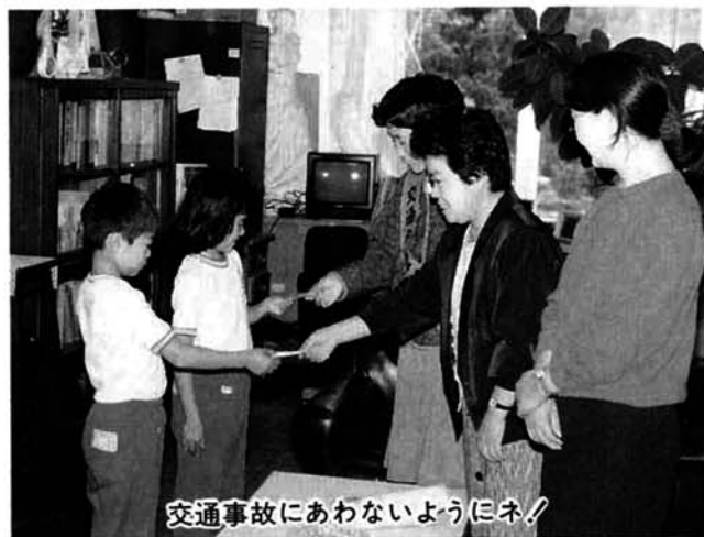
交通事故にあわないようにネ!