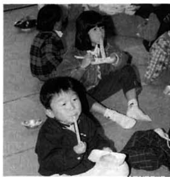
つきたてのモチ...うまかった