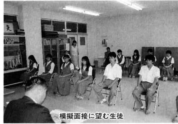
模擬面接に望む生徒

二学期も残りわずかととなり、三年生にとっては進路決定の大事な時期になりました。昨年からはじめて行なわれ、生徒からも好評だった就職模擬面接が今年も寺泊ライオンズクラブ会員の協力をいただいで実施されました。二日間にわたっての面接に三年生全員が挑戦。ライオンズクラブ会員の厳しい質問の応答には不慣れなことも手伝ってか、四苦八苦。指導にあられた会員からの講評は「節度ある動作をする」「質問はよく聞き、意味がわからないときは聞き返すことも良い」「返答する時は、質問者の顔を見て」「自信をもって大きな声で話す」など細かなところまで指摘されていました。生徒からは「模擬面接は、的確な質問をさ