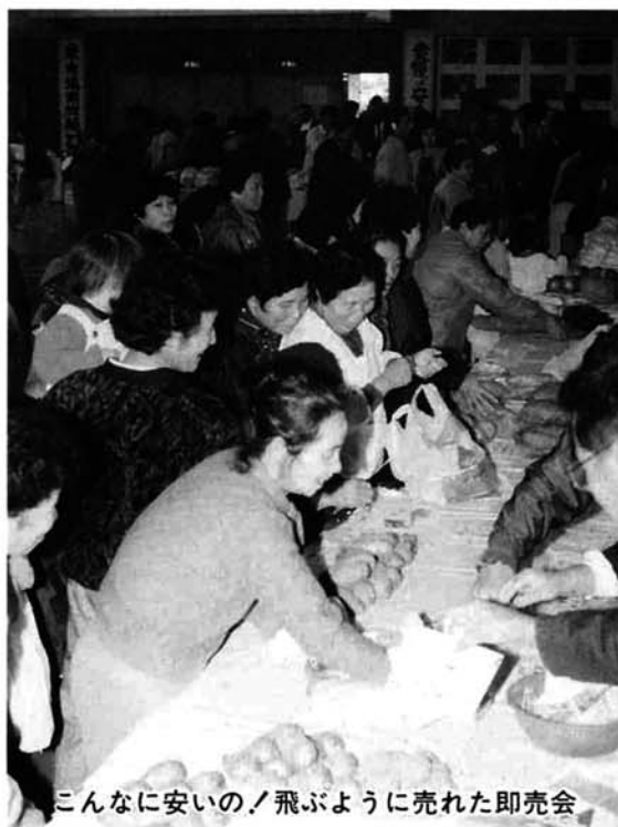
こんなに安いの! 飛ぶように売れた即売会