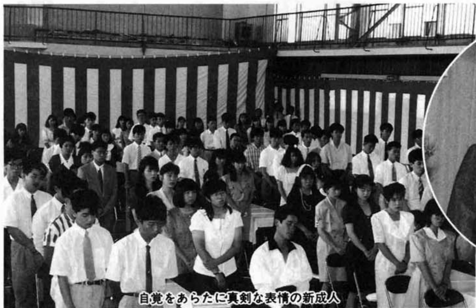
自覚をあらたに真剣な表情の新成人

事をまかせたり、この知識は知っているだろうと思つて聞いたりする。それができるかできないかは個々の能力によるが自分の成すべき最低の事だけはやっておかなければならないと思ふ。また、今まで帰属していたものからの精神的、経済的自立をしなければならぬと思ふ。自分が好きで何がやりたいのか、自分はこれからどういった生き方をしなければならぬのか、本当の自分の姿を探し、一步一步それに近づけたらいいと思ふ。成人式というのは形式上で単なる通過点にすぎないが立ち止まって考える時を与えてくれるものもあると思ふ。