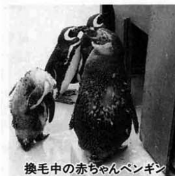
換毛中の赤ちゃんペンギン

またこの一年間は全身黒っぽい羽根におおわれていましたが7月中旬ごろから羽根が抜けはじめ新しい羽根にかわっていききました。(このことを換毛といい、ペンギンは一年に一回、7月〜10月頃換毛します)換毛には約2週間ほどかかり、換毛後の2羽の赤ちゃんペンギンは親のマゼランペンギンと同じ模様となり、換毛前とは全く別のペンギンのようになりました。