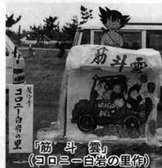
「筋斗雲」 (コロニー白岩の里作)