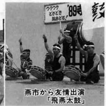
燕市から友情出演 「飛燕太鼓」