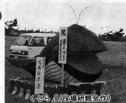
「くじら」(役場研親会作)

ちびっこも大喜び！ 大好評だった「手づくり 灯ろうコンテスト」 も2年目を迎え、素人 とは思えない出来ばえ でした。