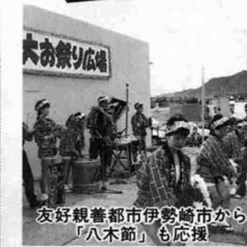
友好親善都市伊勢崎市から 「八木節」も応援