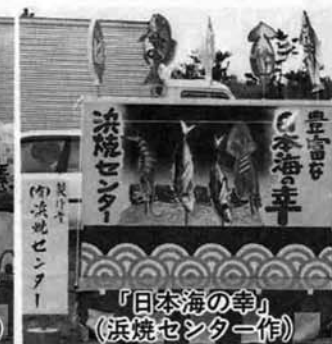
「日本海の幸」 (浜鏡センター作)