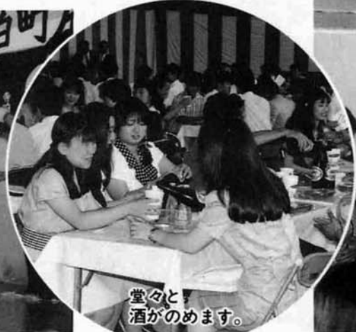
堂々と酒がのめます。