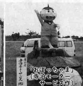
「おぼっちゃま」 (寺泊モーター サービス作)