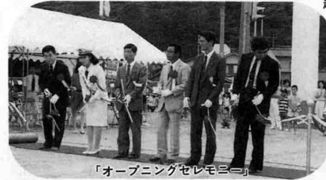
「オープニングセレモニー」