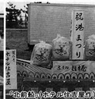
「北前船」(ホテル住吉屋作)