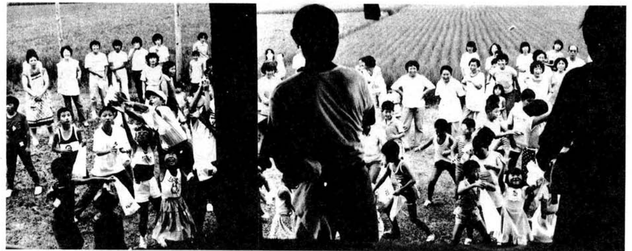
本堂の中から「もちまき」を「そら、まくぞ、まくぞ!!」

子供育成会では「相野原にはいままで祭りの伝統行事がなかったので、この観音堂の祭りを年中行事として定着させて行きたい……」と話しています。