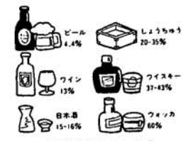
酒の種類とアルコール度