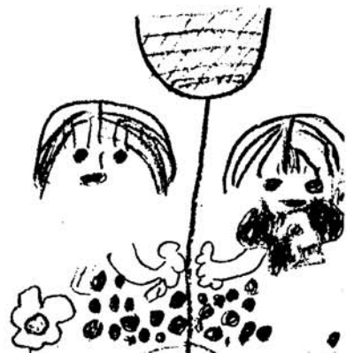
玉入れ いくつ入るかな? やまだ かおり(5歳) 中央保育園