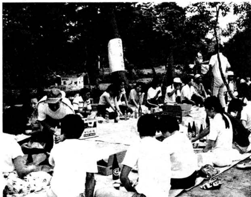
汗をかいたあとのビールはうまい……

5年目を迎えたこの事業がきっかけになってすでに何組かのカップルも誕生し、成果があがっています。