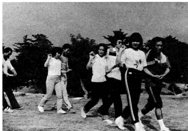
フォークダンスでルンルン

8月8日、森林公園において「若者のレクリエーション」が開かれました。農業委員会が後継者対策の一つとして毎年開いているこの交流会に、ことしは十日町市から17名の若い女性を招き、小国の若者28名と一しょに、トリムコースで汗を流したり、レクリエーションゲームなどで楽しいひとときを過ごしました。