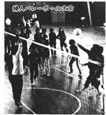
婦人バレーボール大会