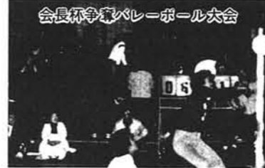
会長杯争奪バレーボール大会