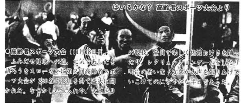
高齢者スポーツ大会(11月18日)の競技、全員で楽しく佐渡おけきを踊ったり、レクリエーションゲームをしたり、明けの早い夜、女衆が大声を張りあげ笑いこけてのにぎやかな半日であった。