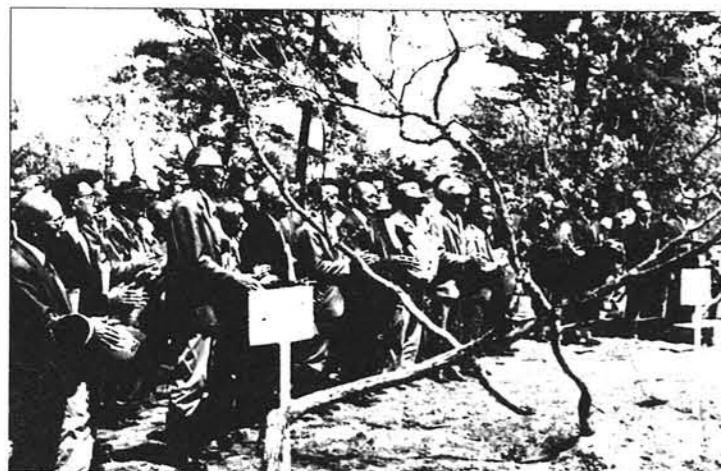
▶ 出席者全員による「モミジ」植樹