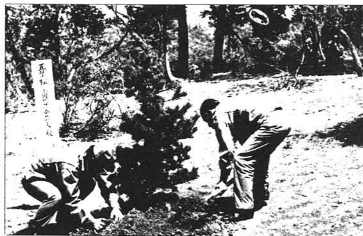
▲ 記念植樹 議長