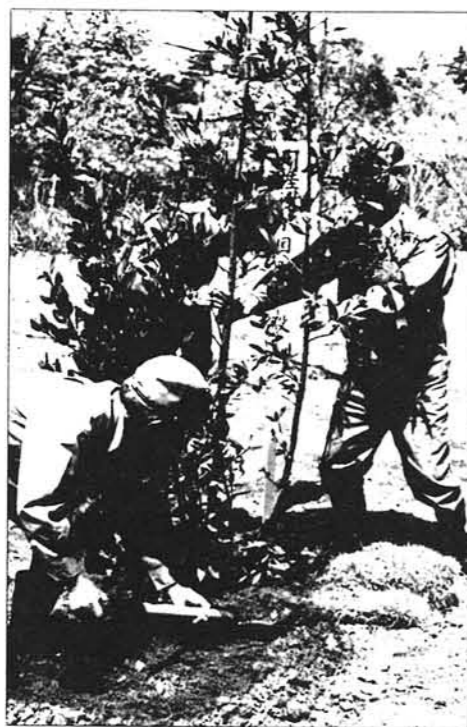
▲ 記念植樹 町長