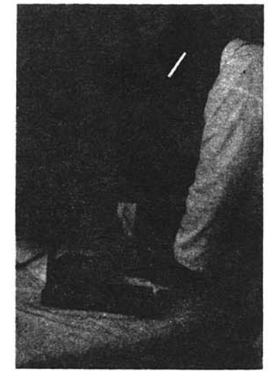
定期的に血圧などの検診を受けましょう