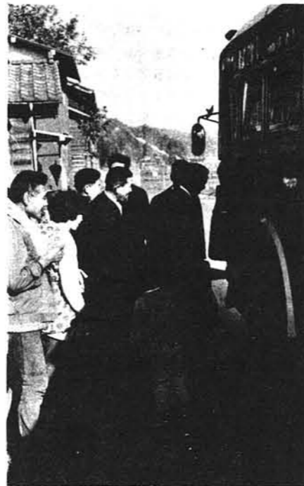
家族の見送りを受けて 元気に出稼ぎに出発（東京品川へ） ——森光にて

正月帰省バスを希望されている 方で、まだ申込みをしていない人 は至急役場へ電話してください。