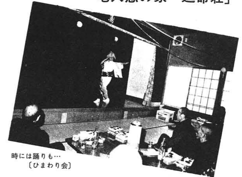
時には踊りも… 〔ひまわり会〕

老人クラブの方々は定期的に利用される団体、不定期的な団体とまちまちですが、歌あり踊りありで毎回楽しくにぎやかに1日をすごしており、時には町内の愛好者の踊りや人形劇などが上演され、お年寄から喜ばれております。