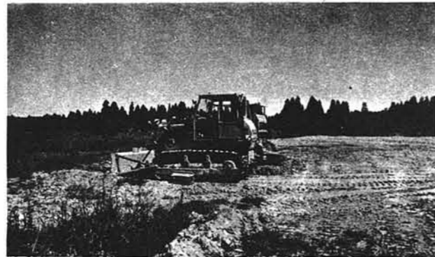
整地工事も始まった

源である電力供給も解決しました。電気は大量に使用するため、小千谷の変電所から小国の工場まで特別に専用送電線を設置することになりました。 工場の建設は、建物などの配置計画がまとも現在設計中ですが、工場が大規模なため「工場立地法」による届出を通産省に出し、許可のあり次第着工されることとなりますが、会社では本年中に事務所と厚生施設の基礎工事を完成させたいということであり、工場本体は雪消えと同時に着工の運びになるもようです。