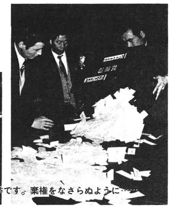
7月7日は第10回参議院議員通常選挙です。棄権をなさぬように……