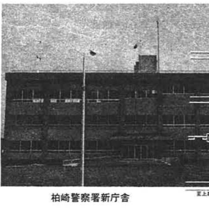
柏崎警察署新庁舎