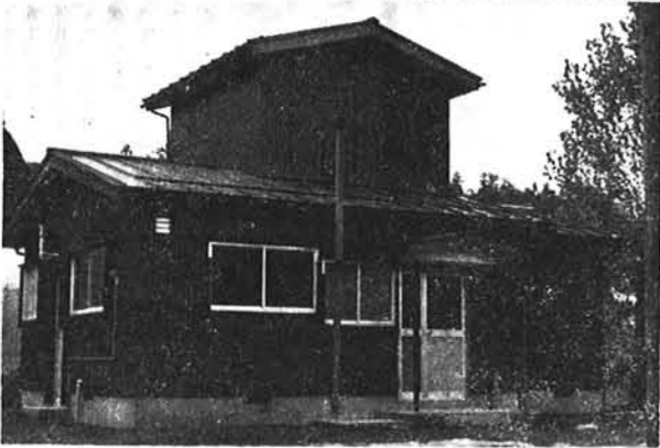
総合竣工式対象事業の1つ 町道整備金沢線(上)と 山野田分校教職員住宅(左)