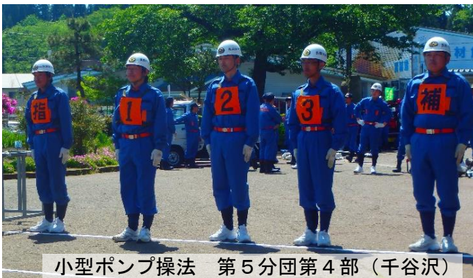
小型ポンプ操法 第5分団第4部（千谷沢）

5月19日（日）小国支所駐車場において、長岡市消防団小国方面隊春季消防演習を行い、併せて小型ポンプ操法競技会を実施しました。