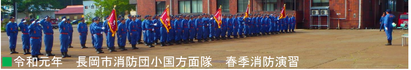
■ 令和元年 長岡市消防団小国方面隊 春季消防演習

5月19日（日）小国支所駐車場において、長岡市消防団小国方面隊春季消防演習を行い、併せて小型ポンプ操法競技会を実施しました。