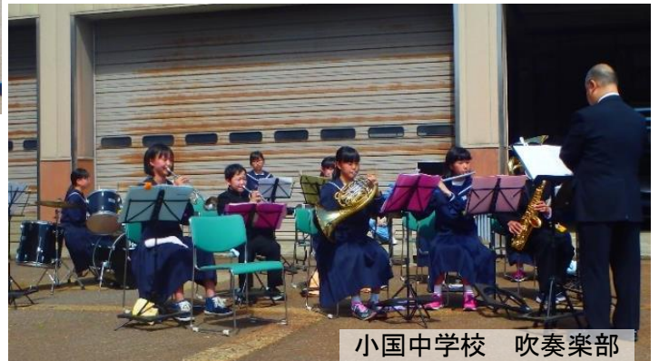
小国中学校 吹奏楽部