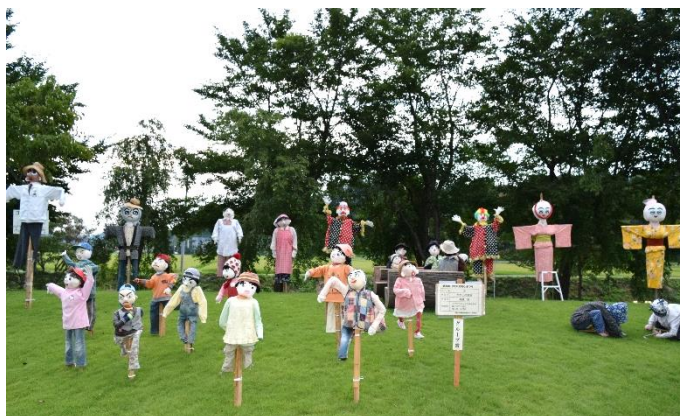
昨年「第9回おぐにかかしまつり」の様子

小国の夏の風物詩“かかしまつり”を今年も開催します。アイデアいっぱいの作品をご応募ください。