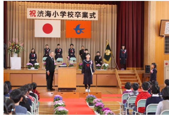
第 31 回卒業式の様子 3 月 22 日（水）