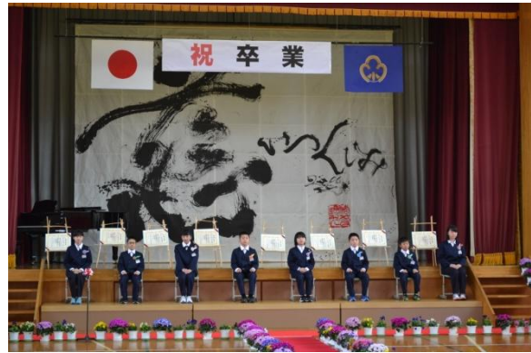
第 47 回卒業証書授与式の様子 3 月 22 日（水）