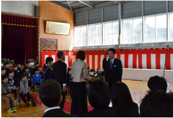
閉校式 校旗返納の様子 3 月 22 日（水）

3 小学校でそれぞれ閉校式が行われ、大勢の出席者に惜しまれながら校旗が返納されました。