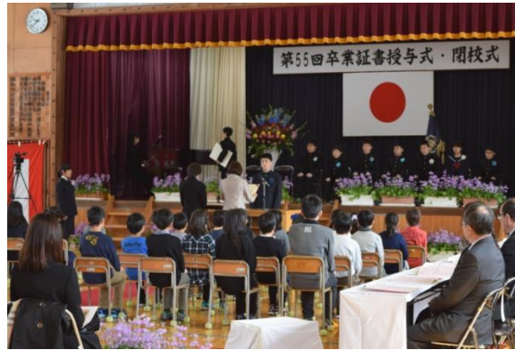
第 55 回卒業証書授与式の様子 3 月 22 日（水）

3 小学校でそれぞれ卒業式が行われ、8 名（上小国小）・10 名（碧海小）・10 名（下小国小）の卒業生が学び舎を巣立ちました。