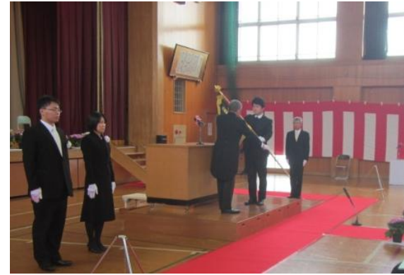
閉校式 校旗返納の様子 3 月 22 日（水）