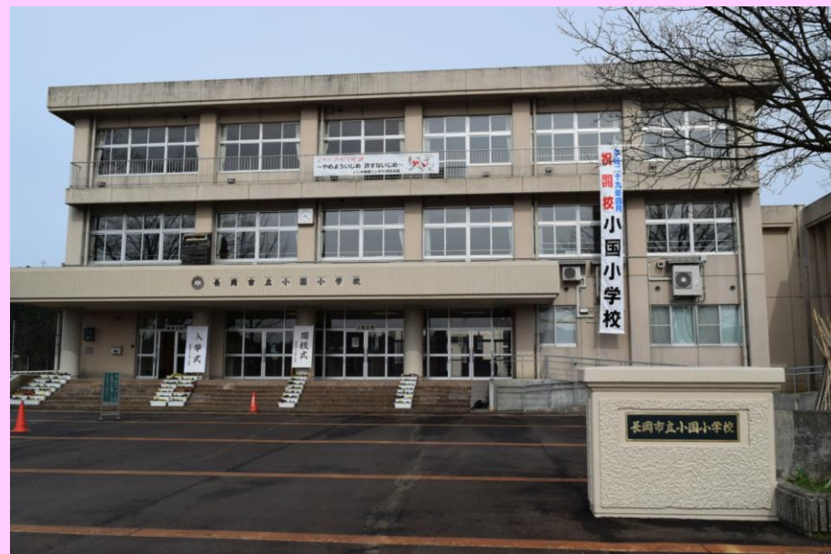
新生！長岡市立小国小学校の誕生です！164 名の児童が通学します。