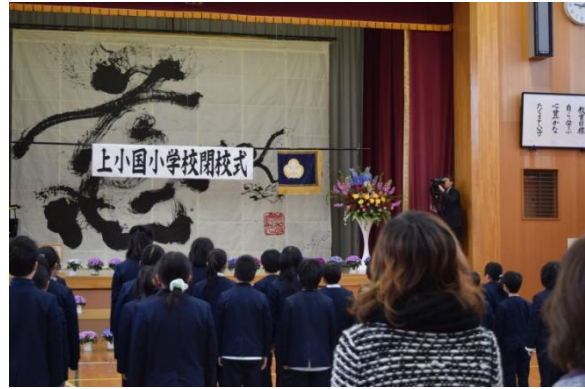
閉校式 校旗返納の様子 3 月 27 日（月）

3 小学校でそれぞれ卒業式が行われ、8 名（上小国小）・10 名（碧海小）・10 名（下小国小）の卒業生が学び舎を巣立ちました。