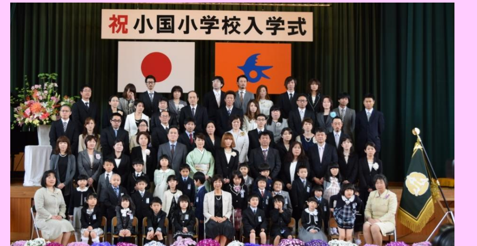
入学式 4 月 10 日（月）