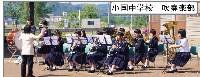
小国中学校 吹奏楽部

小型ポンプ操法競技会 優勝 第5分団 第5部 鷲之島 第2位 第4分団 第3部 桐沢 第3位 第3分団 第3部 八王子