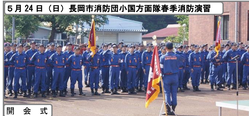
5月24日(日) 長岡市消防団小国方面隊春季消防演習

問 小国地区母子保健推進員協議会 (事務局：市民生活課保健係) ☎95-5900