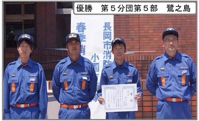
優勝 第5分団第5部 鷲之島

小型ポンプ操法競技会 優勝 第5分団 第5部 鷲之島 第2位 第4分団 第3部 桐沢 第3位 第3分団 第3部 八王子