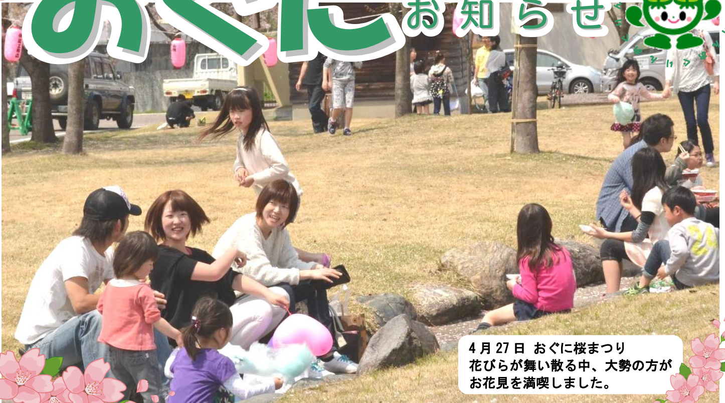
4月27日 おぐに桜まつり 花びらが舞い散る中、大勢の方が お花見を満喫しました。