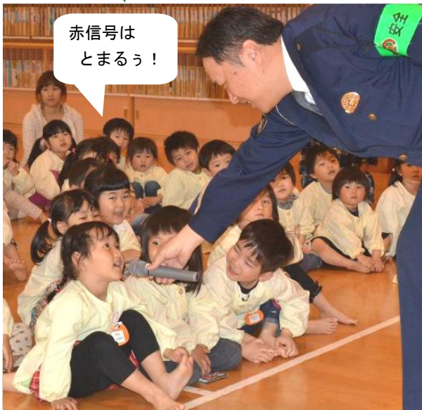
赤信号は とまるう！