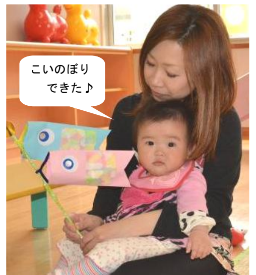
こいのぼり できた♪