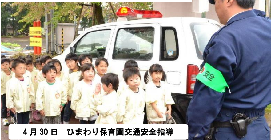
4月30日 ひまわり保育園交通安全指導