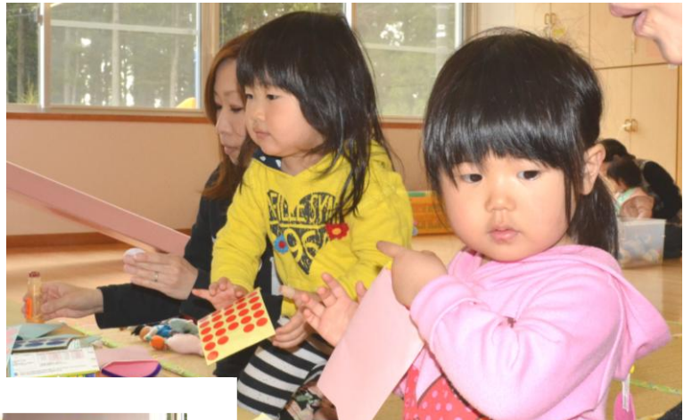
4月30日 子育て支援センターたんぽぽの親子工作♪