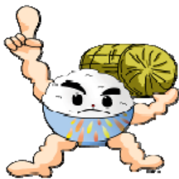
長岡うまい米キャラクター「まんまくん」

長岡市の米生産農家が追求する「安全・安心・美味しい」米の全国発信と、長岡米の一層のレベルアップを目的とし、穀粒判別機、食味評価機器と炊飯食味計、そして最終審査は審査員によるご飯の食べ比べにより味を競います。あなたの作ったおいしいお米の実力を試してみませんか！