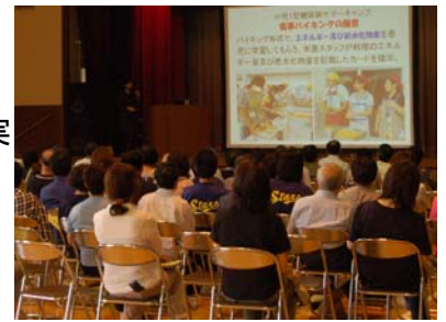
元気な小国を育てる事業 講演会の様子