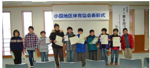
体育奨励賞のサッカークラブの皆さん

2 月 2・3 日（土・日）の 2 日間、八王子・芝ノ又集落に除雪ボランティア「スコップ」のみなさんが来られました。新潟県が募集・登録を行っている除雪ボランティアで、2 日には 25 名、3 日は 24 名の方が参加されました。埼玉、東京、千葉、神奈川の関東圏を中心に遠くは、福島県、岐阜県、山梨県から参加されている方もいました。