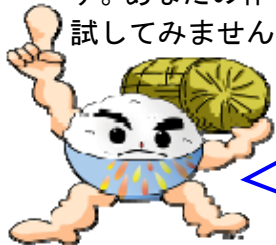
長岡うまい米キャラクター「まんまくん」

今回で4回目となるこのコンテストは、長岡市の米生産農家が追求する「安全・安心・美味しい」米の全国発信と、長岡米の一層のレベルアップを目的とし、食味評価機器とご飯の食べ比べにより味を競います。あなたの作ったおいしいお米の実力を試してみませんか！？