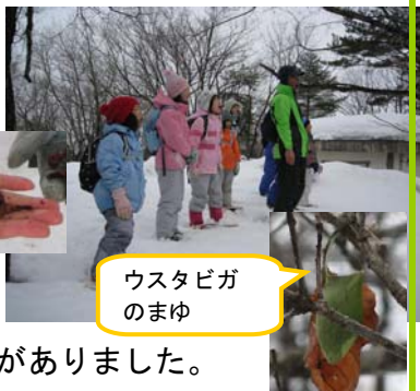
ウスタビガのまゆ

通称「ヤッホー平」でこだま体験もしました。他にもウスタビガの繭など、たくさんの発見がありました。