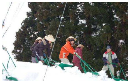
屋根の上での除雪作業