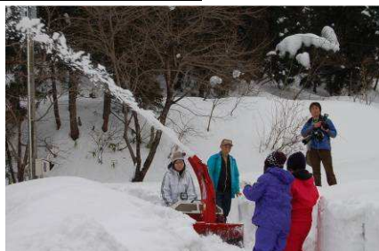
除雪車を運転してみました

都会の人に雪掘りを体験してもらおうと開催された「雪掘ディ」。女子大学生ら70人が参加し、慣れないかんじきを履きながら、一生懸命、汗を流しました。