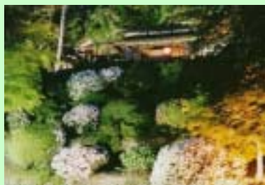
楽山苑ライトアップ