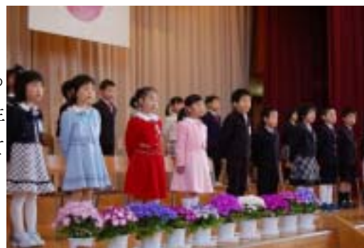
新入生が「1年生になったら」を合唱(渋海小学校)

新入生は緊張した面持ちでしたが元気に初登校。これから始まる学校生活に胸をふくらませていました。渋海小学校では、校長先生からの「たくさん学んでチューリップのように大きな花を咲かせてください」という言葉に「はい」と大きな声で答えていました。今年の小国地域内の新1年生は、上小国小学校8人、渋海小学校22人、下小国小学校17人、小国中学校45人です。