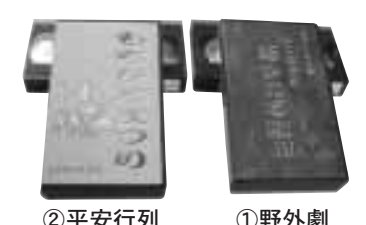
① 野外劇 ② 平安行列

2月27日(日)、町民有志による「雪上エンデュロ走行会」が開かれます。本年度は、震災の影響もあり例年とは違う走行会形式での開催ですが、地震に負けず復興を祈願したイベントです。会場は養楽館前特設会場、時間は午前9時～午後3時頃を予定しています。多数の皆さんのおいでをお待ちしています。