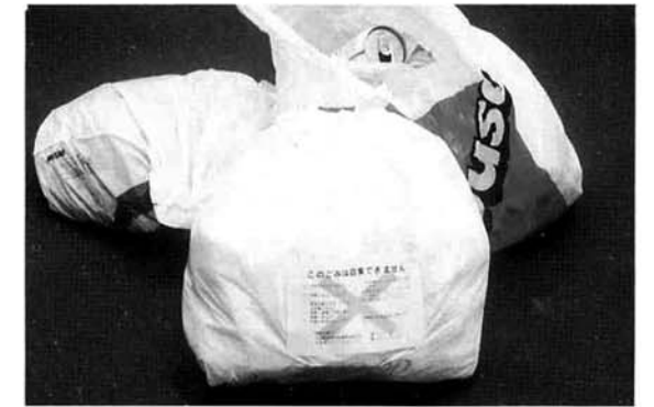
▲Xマークシールのゴミ、気をつけて!!

燃えるゴミ(可燃ゴミ)の中に空き缶等が沢山入っていたのが、ステッカーを導入してから皆さんの意識が向上したので大変良くなりつつあります。(保健衛生推進委員さんと総代さんの苦勞の賜物です)