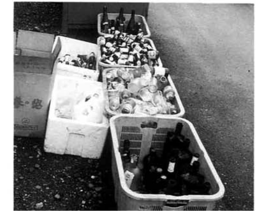
▲きちんと出せば、りっぱな資源です