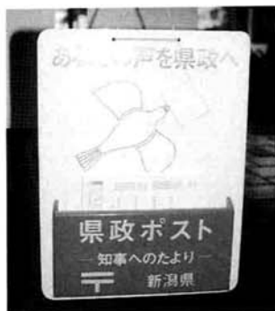
▲役場1階ロビーにあるポスト

県では、広く県民の皆様から県政についての建設的なご意見やご提言をお寄せいただくために、次の場所に「県政ポスト」を設置し、所定のはがきを用意してあります。皆様のご意見、ご提言をお待ちしております。