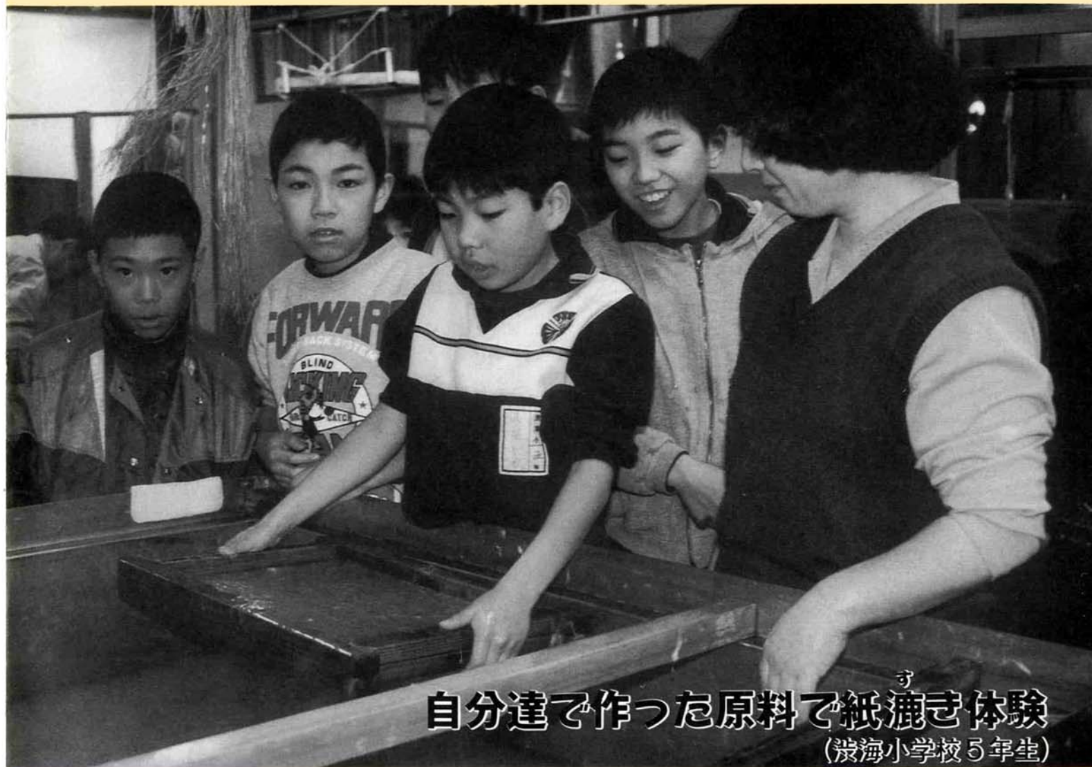
自分達で作った原料で紙漉き体験 (波海小学校5年生)