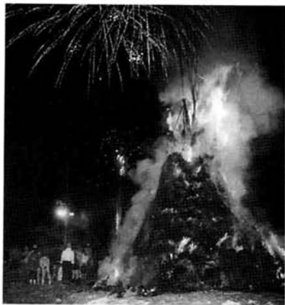
990東のワラで作られたジャンボの神に火をつけて、町民の無病息災・家内安全を祈願しました。