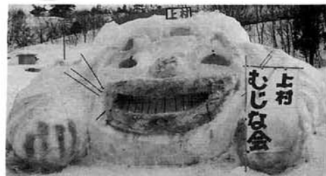
9チームが参加し個性豊かなこもり穴村が出来ました。 なお審査の結果は次のとおりです。