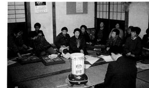
▲小国沢会場の座談会より

今年もただ今巡回中です、「集落座談会」。よそおにも新たに、第7弾です。今年は、福祉係、社会福祉協議会も仲間に加わって、内容もり沢山!!メインは「運動のメリット」どこでもできるとっても手軽な体操の紹介です。あなたも会場でチャレンジしてみてください。3月は、つぎの集落におじゃまします。