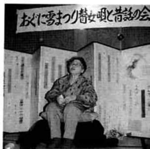
会場いっぱいの観客が時間を忘れたすばらしい会でした。