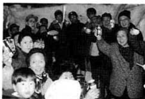
最優秀賞 上村むじな会 優秀賞 七日町 努力賞 小栗山 夢元開(諏訪井)