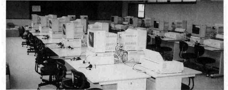
▲小国中学校CAI教室(平成2年度設置)

しかし、情報化社会の中でコンピュータ教育は次世代を担う子ども達にとって非常に重要になってきており、現在整備がすすめられています。