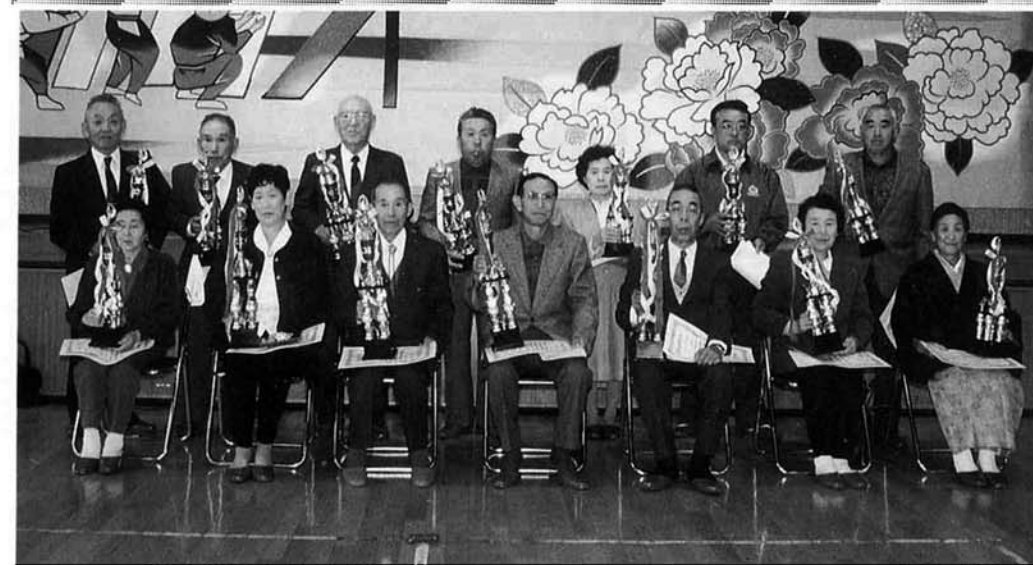
受賞者の方々(当日表彰された方々だけです)