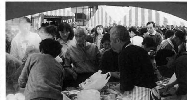
▲やっぱりここが一番