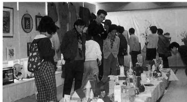
▲子供達のかわいい作品も展示されました