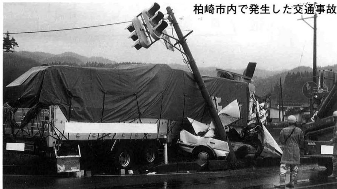
柏崎市内で発生した交通事故

10月1日栃尾市の県道で、54歳の男性が運転する普通乗用車が川に転落する事故が起こり、県内の交通事故による死者は200人となりました。