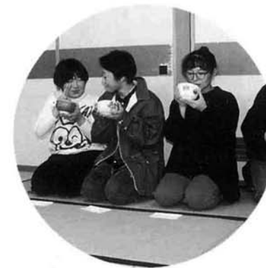
◀お茶のサービスも ありました