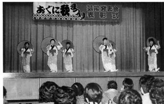
▲日頃の練習の成果を披露した芸能発表会