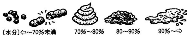
[水分] ←70%未満 70%～80% 80～90% 90%～→