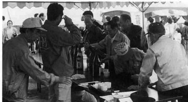
▲どれもおいしい。地酒まつり