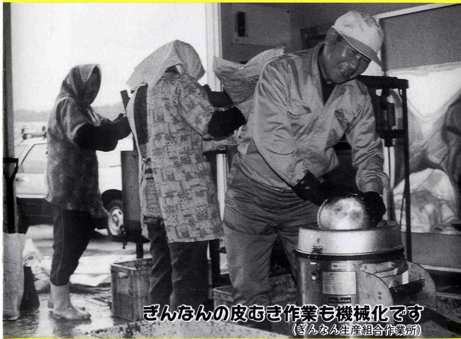
ぎんなんの皮むき作業も機械化です (ぎんなん生産組合作業所)

町の人口 平成6年10月31日現在(前月比) 計 8,172人(-38人) 男 4,013人(-20人) 女 4,159人(-18人) 世帯数 2,243(-3) 平成6年10月の動き 出生 2人 死亡 15人 転入 5人 転出 30人